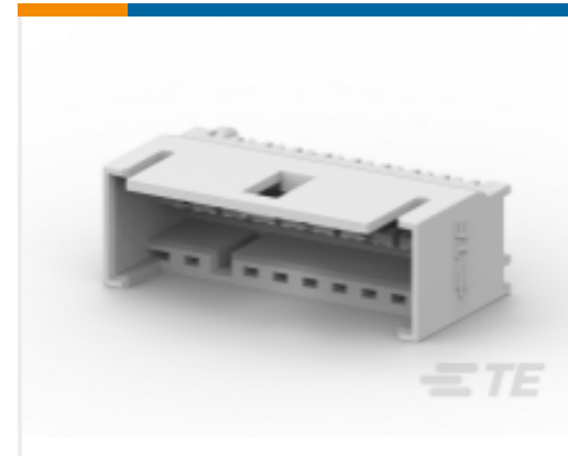
TE 产品编号1-2232962-9 9P POTTED RAST 2.5 HEADER