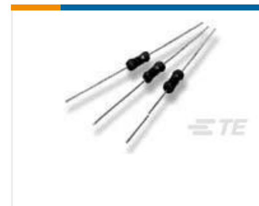
TE 产品编号8-1879350-5 RR01 5% 680R AMMO