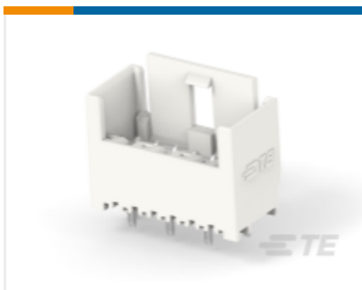
TE 产品编号1-2232960-6 6P POTTED RAST 2.5 HEADER