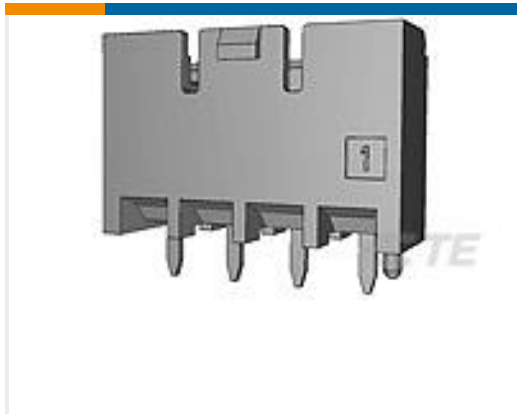
TE 产品编号1376382-1 5mm B-T-W Conn. 2P HDR ASSEMBL