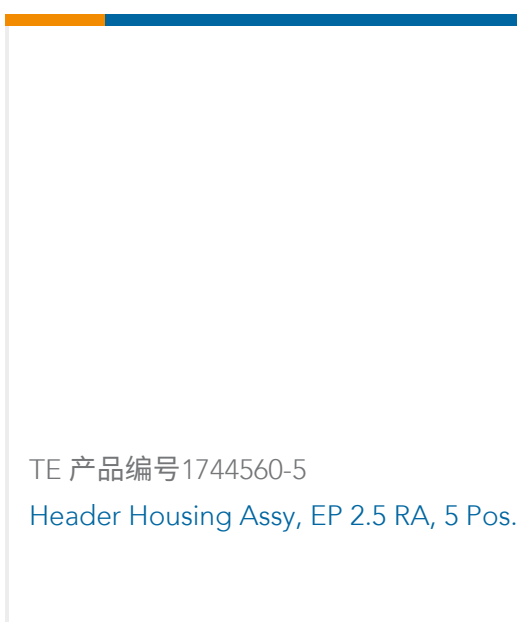
TE 产品编号1744560-5 Header Housing Assy, EP 2.5 RA, 5 Pos.