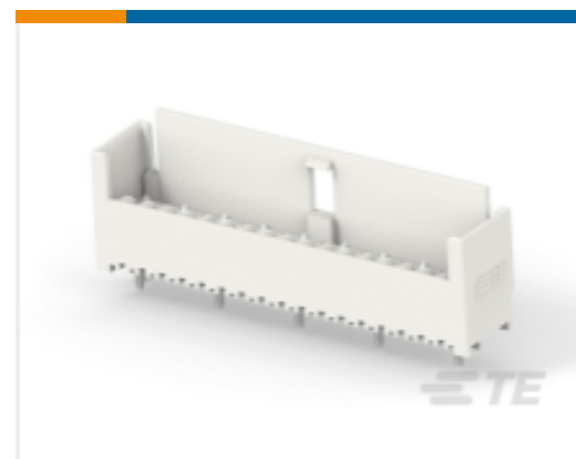
TE 产品编号1-2232963-7 17P POTTED RAST2.5 HEADER