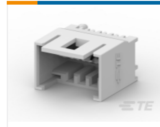
TE 产品编号1-2232960-4 4P POTTED RAST 2.5 HEADER