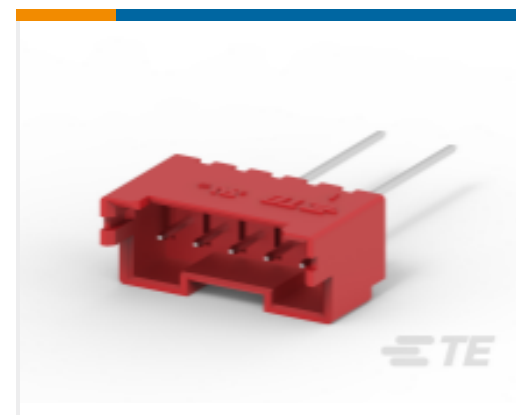
TE 产品编号1-2299683-5 EP2.5 HDR 5P VERT W/O BOSS, TAPING,RED