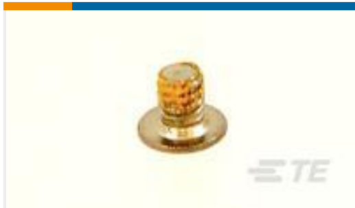
TE 产品编号1410946-1 MULTI-GIG SOC. CAP SCREW, CUSTOMIZED HDW