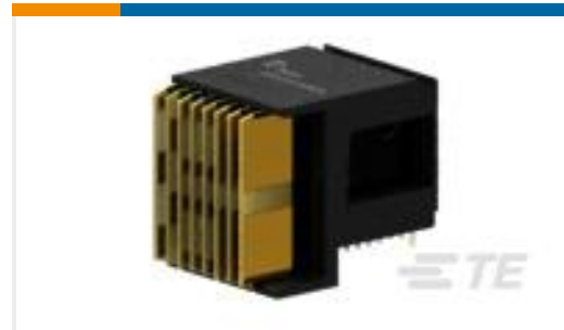
TE 产品编号1410189-3 MULTIGIG RT T2 7RW H-LFT,ET2