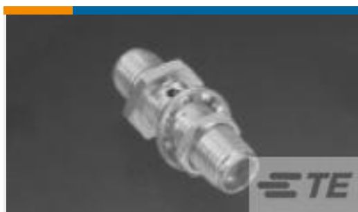
TE 产品编号1054869-1 2084 0000 02