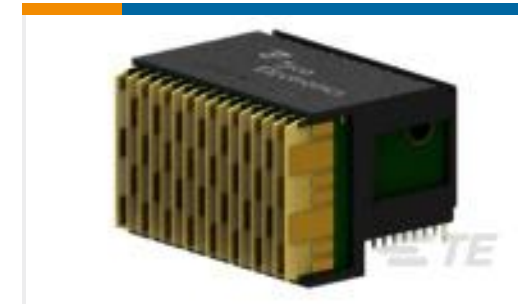
TE 产品编号1410187-3 MULTIGIG RT T2 7RW DC DF CT