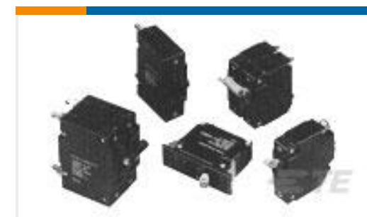
TE 产品编号1-1393255-2 W93-X112-5=M6/M7/M9/W6/W7