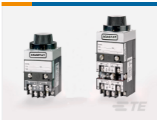
TE 产品编号 1423168-6 E7012AD004=RLY,NUC,ON,2P,120V