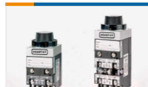
TE 产品编号1755170-1 7022OCIM=RLY,STD,OFF,2P,24V,15S,I,M