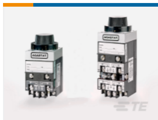
TE 产品编号 1423157-5 7012AC=RLY,STD,ON,2P,120VAC,15