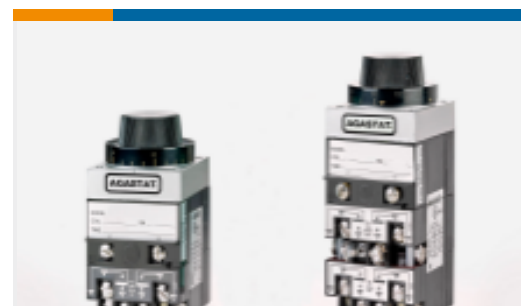
TE 产品编号1755170-1 7022OCIM=RLY,STD,OFF,2P,24V,15S,I, M