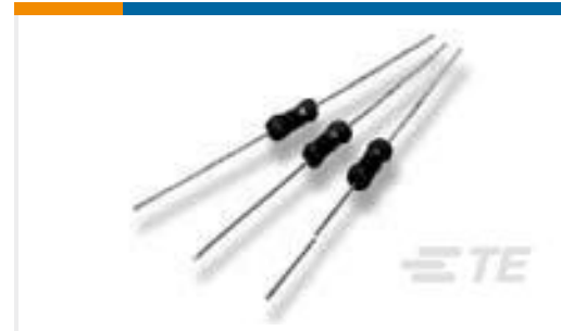
TE 产品编号1-1625892-3 3W SM M/OX 5% 12R