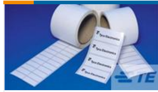
TE 产品编号1768018-8 EET-0880P-9