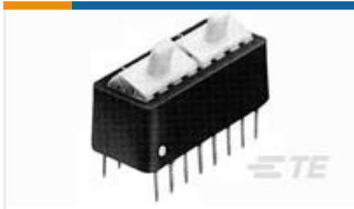
TE 产品编号8-435469-1 DIP SW ASSY-BLK 4PST-4POS