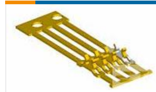
TE 产品编号1544179-2 CONTACT A SOUDER 9