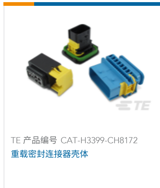
TE 产品编号 CAT-H3399-CH8172 重载密封连接器壳体