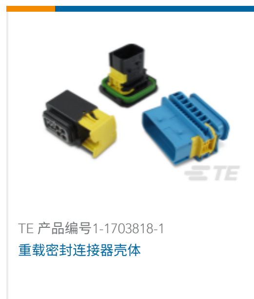
TE 产品编号1-1703818-1 重载密封连接器壳体