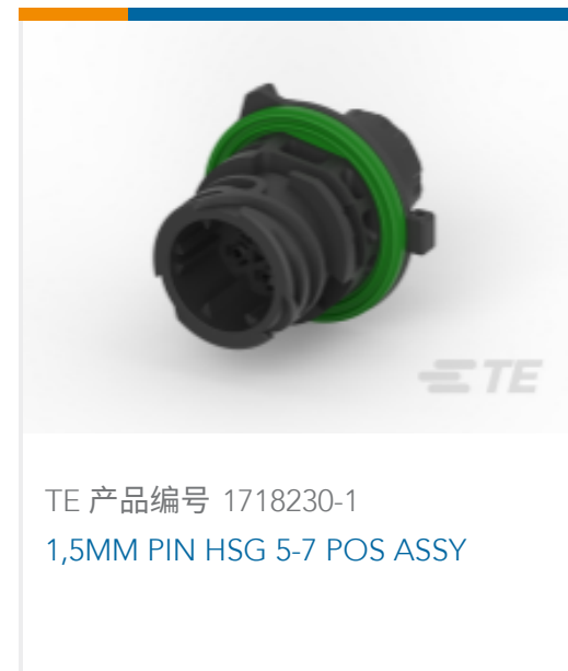
TE 产品编号 1718230-1 1,5MM PIN HSG 5-7 POS ASSY