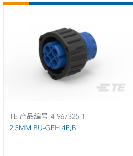
TE 产品编号 4-967325-1 2,5MM BU-GEH 4P, BL