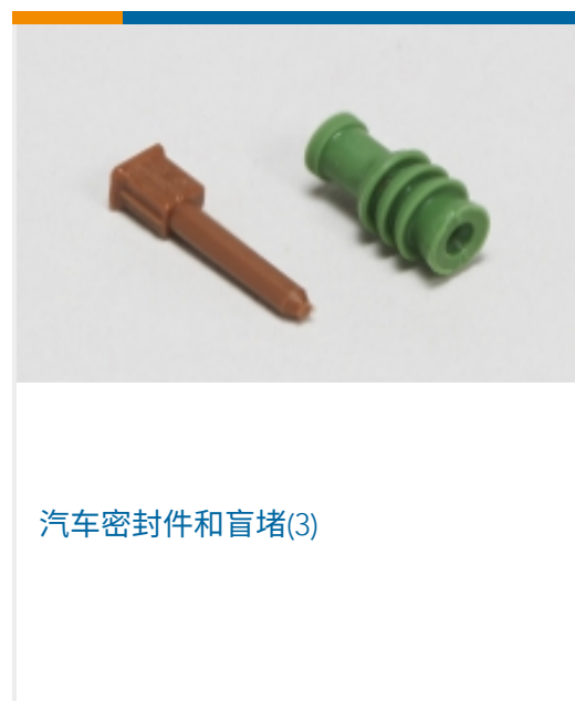
汽车密封件和盲堵(3)