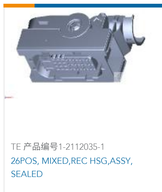
TE 产品编号1-2112035-1 26POS, MIXED, REC HSG, ASSY, SEALED