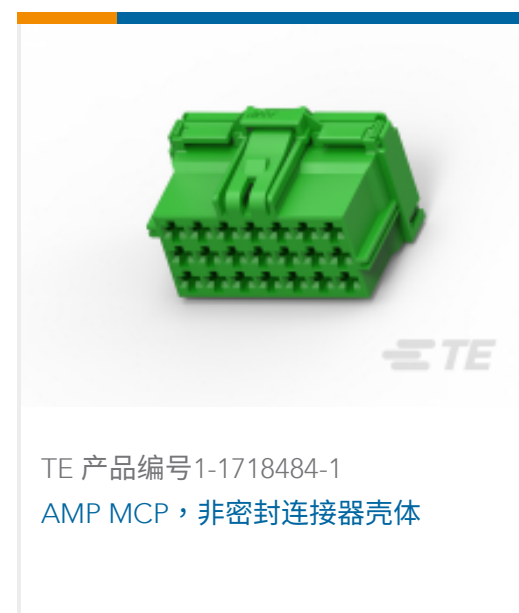
TE 产品编号1-1718484-1 AMP MCP, 非密封连接器壳体