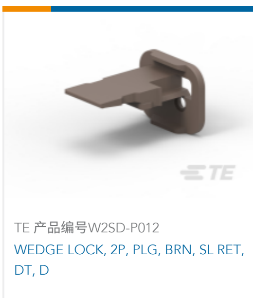
TE 产品编号W2SD-P012 WEDGE LOCK, 2P, PLG, BRN, SL RET, DT, D