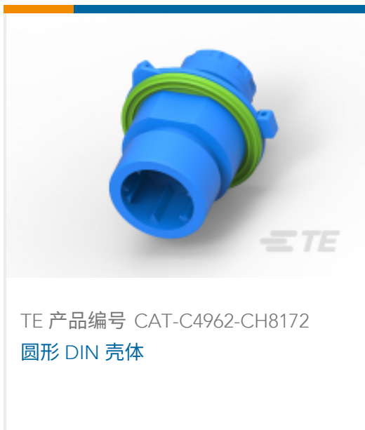
TE 产品编号 CAT-C4962-CH8172 圆形 DIN 壳体