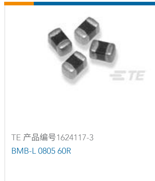
TE 产品编号1624117-3 BMB-L 0805 60R