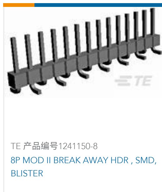
TE 产品编号1241150-8 8P MOD II BREAK AWAY HDR, SMD, BLISTER