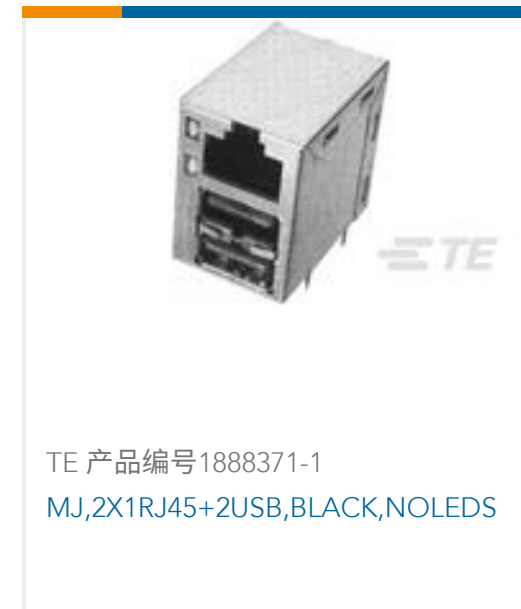
TE 产品编号1888371-1 MJ,2X1RJ45+2USB,BLACK,NOLEDS