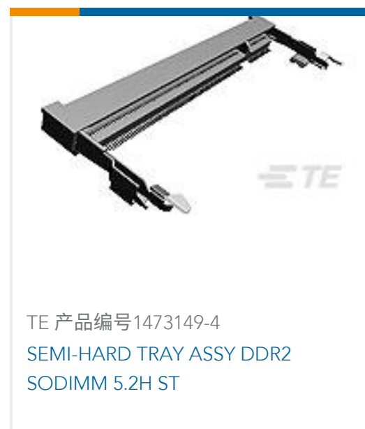
TE 产品编号1473149-4 SEMI-HARD TRAY ASSY DDR2 SODIMM 5.2H ST