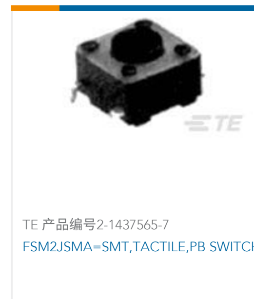
TE 产品编号2-1437565-7 FSM2JSMA=SMT,TACTILE,PB SWITCH