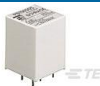
TE 产品编号 8-1415077-1 PB114009