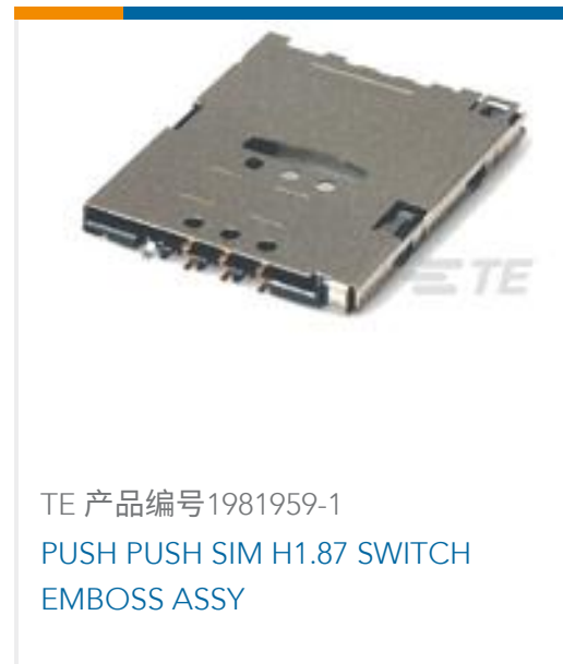
TE 产品编号1981959-1 PUSH PUSH SIM H1.87 SWITCH EMBOSS ASSY