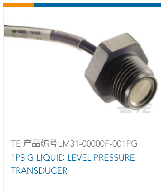
TE 产品编号LM31-00000F-001PG 1PSIG LIQUID LEVEL PRESSURE TRANSDUCER