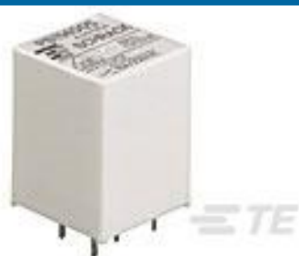
TE 产品编号 9-1415029-1 PB114024