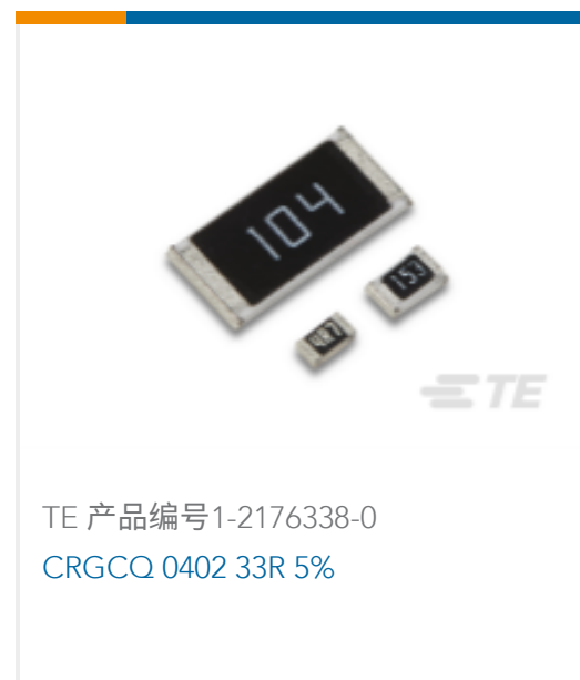
TE 产品编号1-2176338-0 CRGCCQ 0402 33R 5%