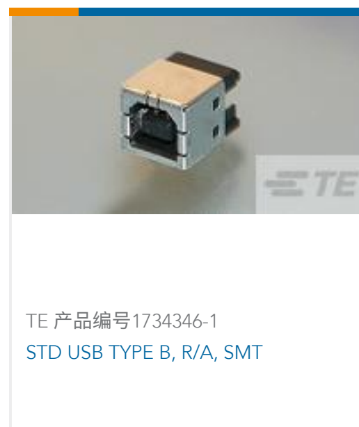
TE 产品编号1734346-1 STD USB TYPE B, R/A, SMT