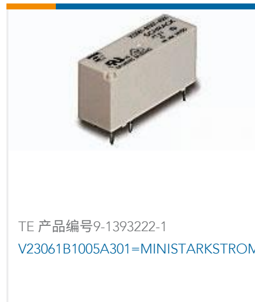
TE 产品编号9-1393222-1 V23061B1005A301=MINISTARKSTROM