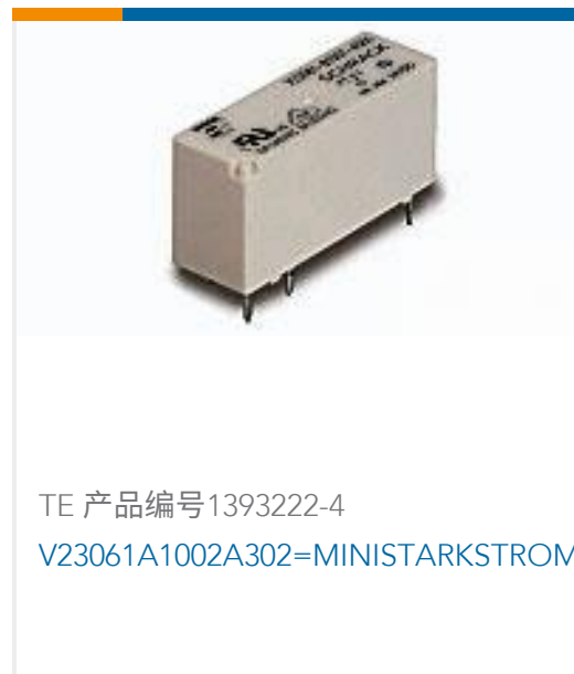
TE 产品编号1393222-4 V23061A1002A302=MINISTARKSTROM