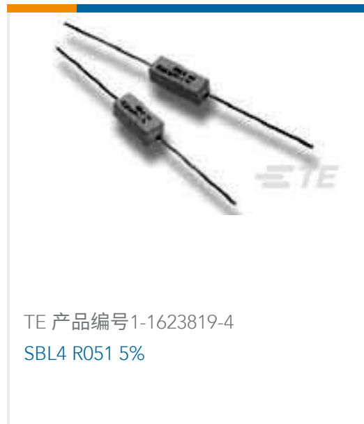
TE 产品编号1-1623819-4 SBL4 R051 5%