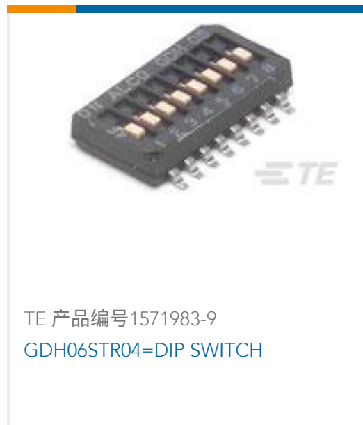
TE 产品编号1571983-9 GDH06STR04=DIP SWITCH