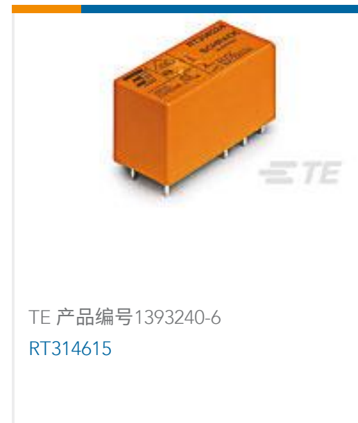
TE 产品编号1393240-6 RT314615