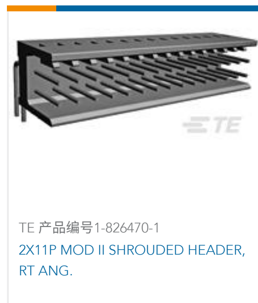
TE 产品编号1-826470-1 2X11P MOD II SHROUDED HEADER, RT ANG.