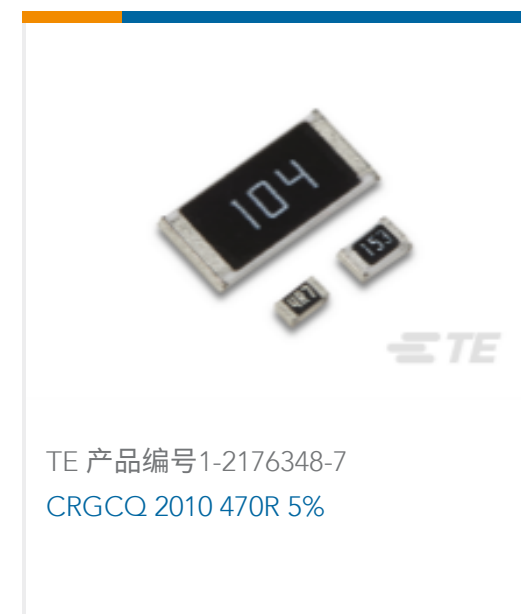
TE 产品编号1-2176348-7 CRGCO 2010 470R 5%