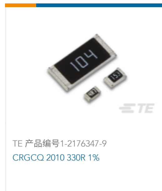
TE 产品编号1-2176347-9 CRGCO 2010 330R 1%