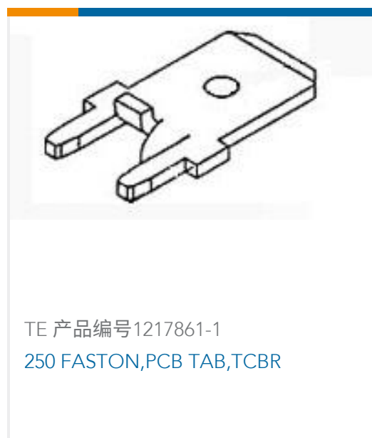
TE 产品编号1217861-1 250 FASTON,PCB TAB,TCBR