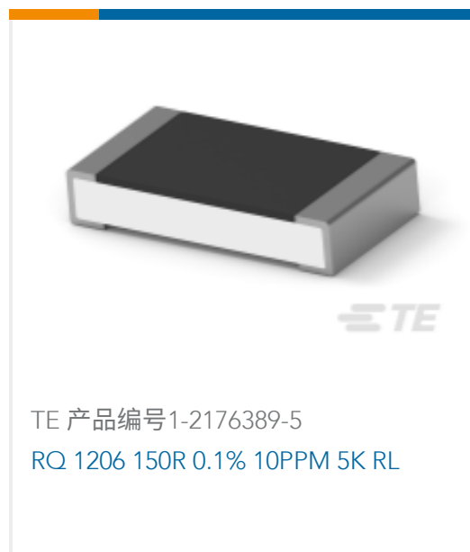
TE 产品编号1-2176389-5 RQ 1206 150R 0.1% 10PPM 5K RL