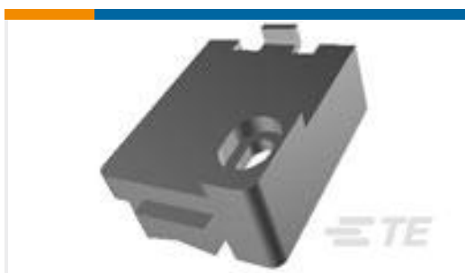
TE 产品编号1-640721-0 06P UMNL STR/REL & INSRT NATL