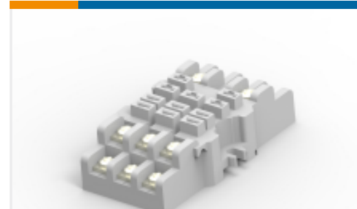
TE 产品编号1393143-5 27E121=SOCKET,KUP,11,SCW,PLE