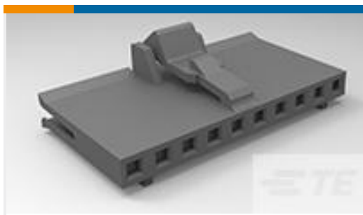
TE 产品编号1-487526-7 018 HOUSING FFC RCPT 100CL SR