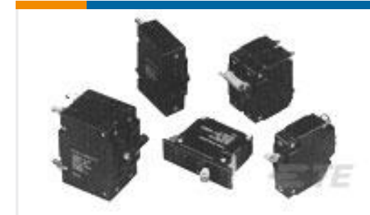
TE 产品编号9-1393253-3 W69-X2Q12-5=M6/M7/M9/W6/W7