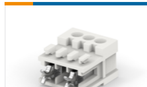
TE 产品编号1-2232890-3 3P MONOPLUG 2.5 SELECTIVELY LOADED