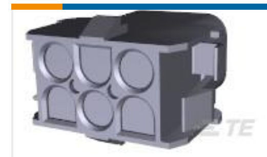
TE 产品编号1-480705-0 06P UMNL CAP HSG NATL