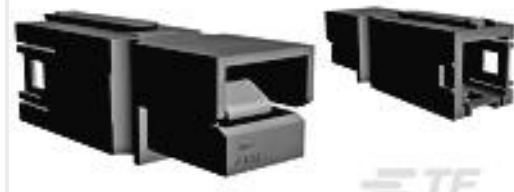
TE 产品编号1445716-5 KIT 6AWG RED