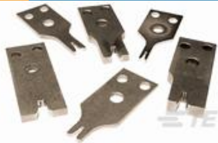
TE 产品编号1-453820-0 CRIMPER, WIRE-.070 WIDE F