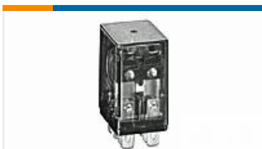
TE 产品编号 4-1393144-1 K10P-11A15-24=K10/K20