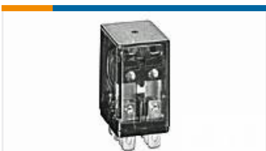
TE 产品编号 3-1393144-1 K10P-11AT1-24=K10/K20