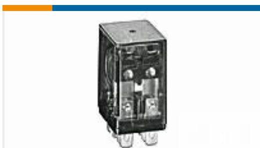
TE 产品编号 4-1393144-7 K10P-11A55-24=K10/K20