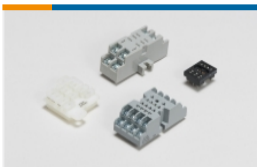
继电器附件、插座和卡笼(3)