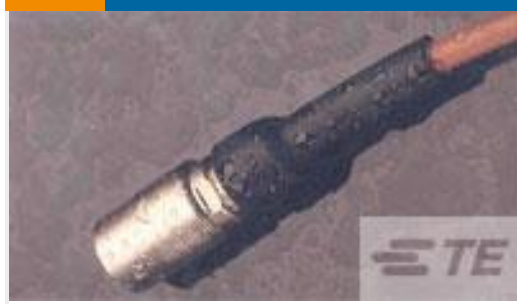
TE 产品编号3421332006 CGAT-6/2-0-STK