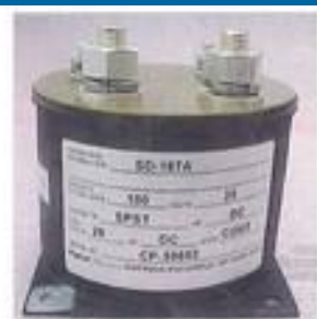
TE 产品编号 1616074-9 SD167A (FAA/PMA)=CONTACTOR SPST 28 VDC 1