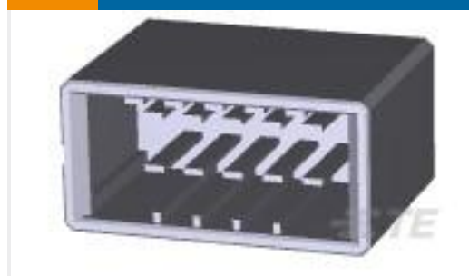
TE 产品编号178325-3 DYNAMIC D3100D HDR V 10P ASSY AU076