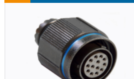
TE 产品编号YDTS26W25-35PAC001 PLUG ASSY