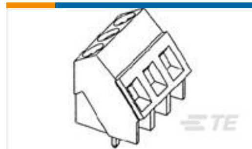
TE 产品编号282847-2 TERMI-BLOK PCB MOUNT 35 2P.5