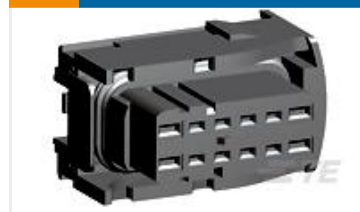
TE 产品编号284848-1 12 POS MCP HYBRID FEMALE CONN