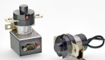
TE 产品编号 8-1616977-1 K200A3C=CONTACTOR SPST DB 200 AMPS