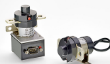
TE 产品编号 6-1616970-0 K200B1C=CONTACTOR SPST NO DB 200 AMPS