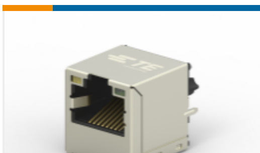
TE 产品编号2301995-4 RJ45 JACK INT.MAG. 1GB LED 1X1 VERT.