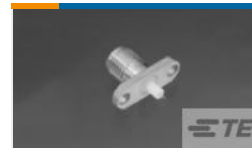
TE 产品编号1052926-1 2052 8002 92