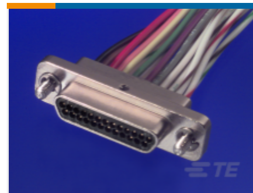
TE 产品编号1532172-9 M83513/04-B13N, MCKS-N1-B-15S6G1-72.0