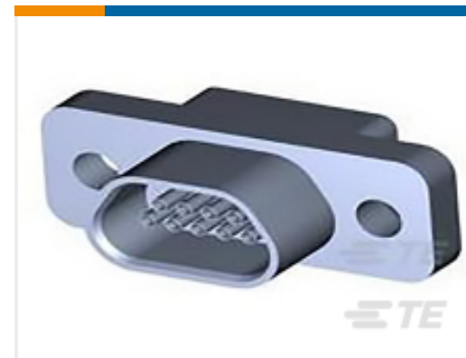
TE 产品编号1532176-1 M83513/04-F01N, MCKS-N1-B-37S6G1-18.0