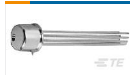
TE 产品编号1617164-3 JMACT-26XM = M28776/1-030M