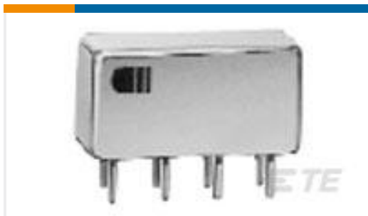
TE 产品编号1-1617039-8 HMS1201S004 = 2100 HMS RELAY