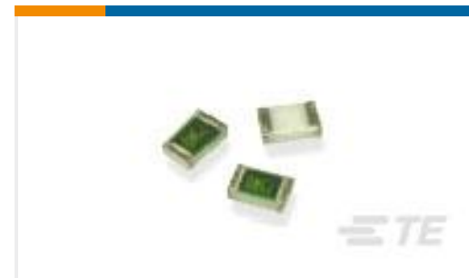
TE 产品编号1676226-2 RN 0805 1K21 0.1% 10PPM 1KRL