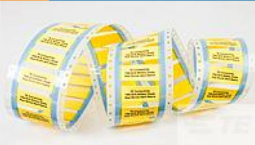
TE 产品编号 1297970001 TMS-SCE-1K-1-2.0-2