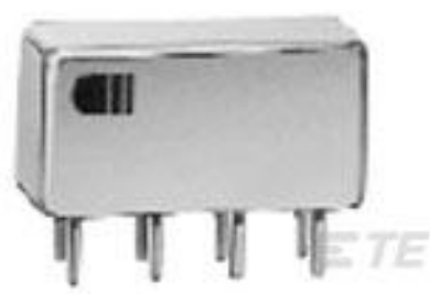
TE 产品编号 2-1617031-0 HFW1201K45 = M39016/6-109L