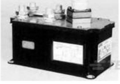
TE 产品编号 1616083-7 A981S=CONTACTOR