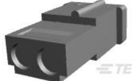
TE 产品编号 1-480318-0 02P CMNL PLUG HSG F/H NATL