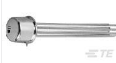
TE 产品编号 1-1617122-5 JMACD-26XP = M39016/15-081P