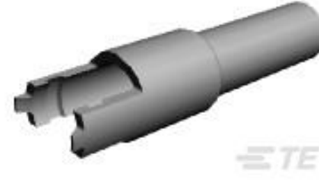
TE 产品编号 1-480351-0 01P CMNL CAP HSG NATL