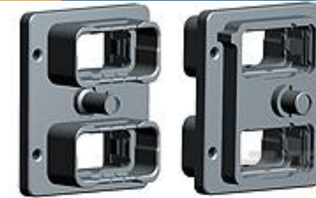
TE 产品编号 1811646-1 PLUG SHELL ASY, VERT