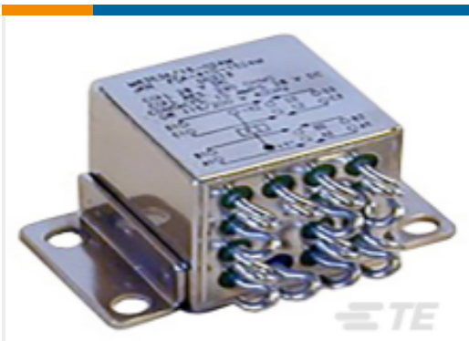
TE 产品编号1617754-8 FCA-410-1602M=M83536/16-002M