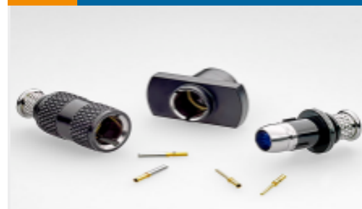
TE 产品编号2226920-1 NETT WARRIOR RECEPTACLE ASSEMBLY