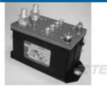
TE 产品编号1616058-1 A703=RELAY