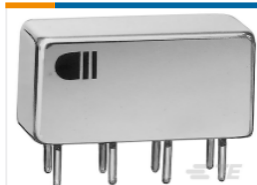
TE 产品编号3-1617073-5 3SBC2092A2 = M39016/37-022P