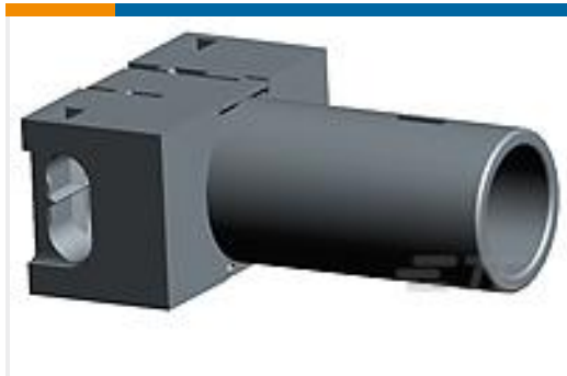
TE 产品编号1-2213222-1 NECTOR S BUS BAR SEALED US, THRU HV-3