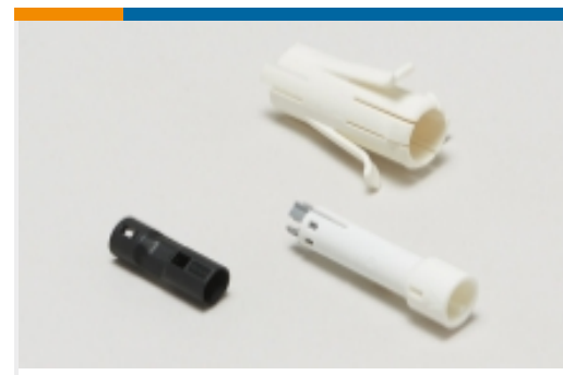
插头和插座照明连接器附件(57)