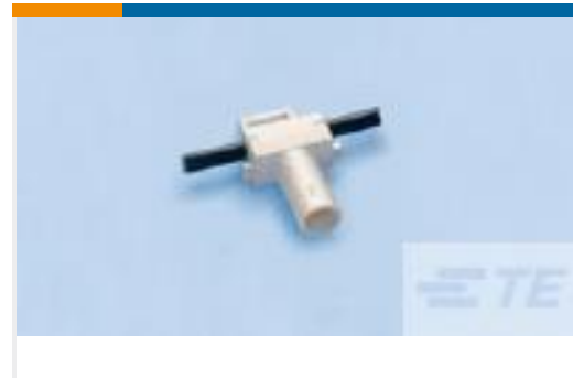
TE 产品编号293270-3 NECTOR S BUS BAR SEALED CONN HV-1