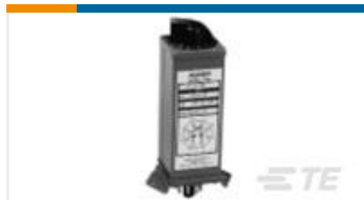
TE 产品编号1423152-2 2112D9NE=RLY,MINI,ON,2P,28VDC,