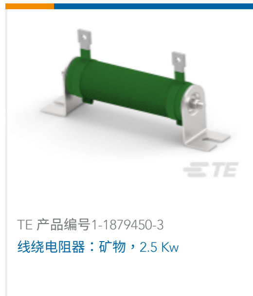
TE 产品编号1-1879450-3 线绕电阻器：矿物，2.5 Kw