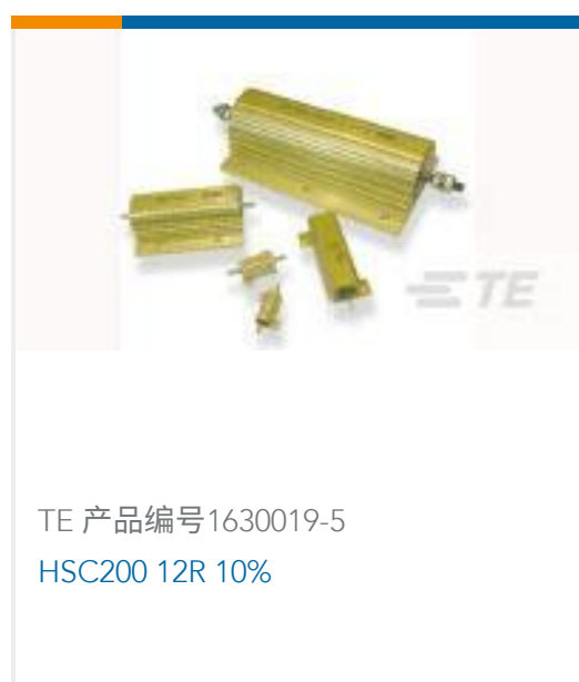
TE 产品编号1630019-5 HSC200 12R 10%