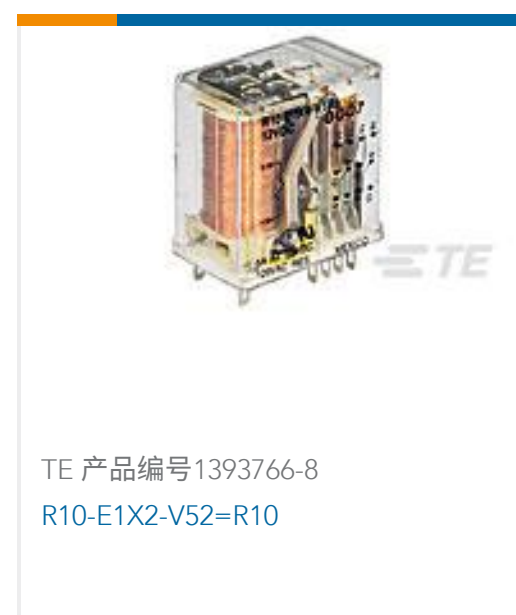
TE 产品编号1393766-8 R10-E1X2-V52=R10