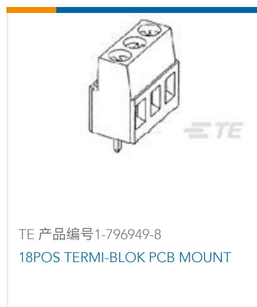
TE 产品编号1-796949-8 18POS TERMI-BLOK PCB MOUNT