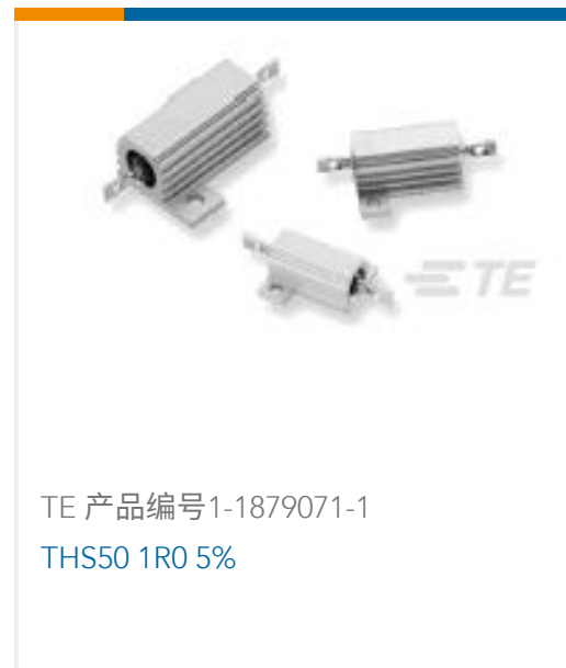
TE 产品编号1-1879071-1 THS50 1R0 5%