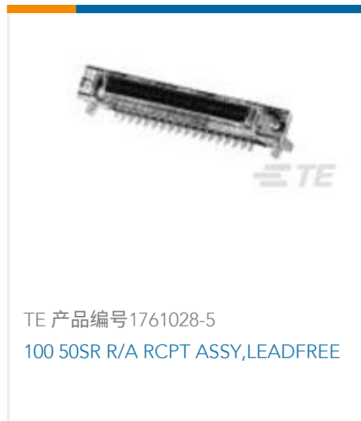
TE 产品编号1761028-5 100 50SR R/A RCPT ASSY, LEADFREE