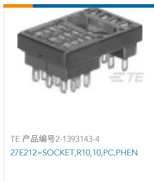
TE 产品编号2-1393143-4 27E212=SOCKET, R10, 10, PC, PHEN