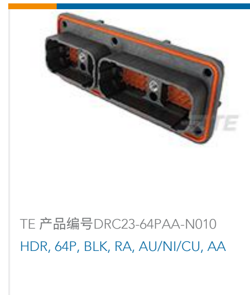
TE 产品编号DRC23-64PAA-N010 HDR, 64P, BLK, RA, AU/NI/CU, AA