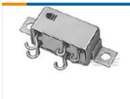
TE 产品编号1617087-3 CBW-1C-24B = HALF.10A.1 POLD F