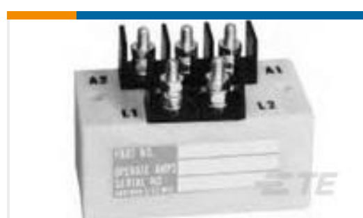
TE 产品编号 1616131-4 Q50AC=RELAY