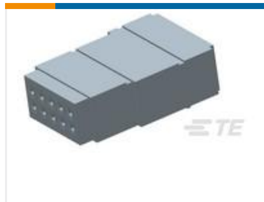
TE 产品编号2221385-1 TJ F/B, SZ20, MODULE W/5 RESISTORS