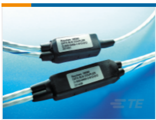
TE 产品编号528719-000 D-500-0255-562-1