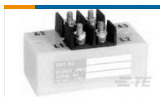
TE 产品编号 1-1616131-1 Q50S (FAA/PMA)=RELAY