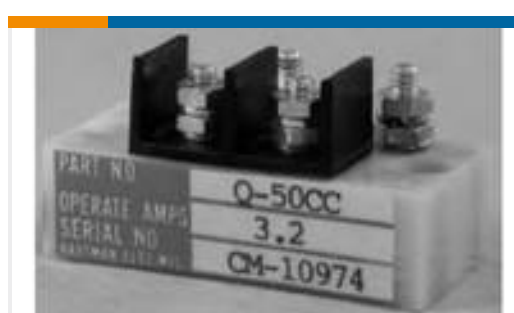
TE 产品编号 1616131-7 Q50CC (FAA/PMA)=RELAY