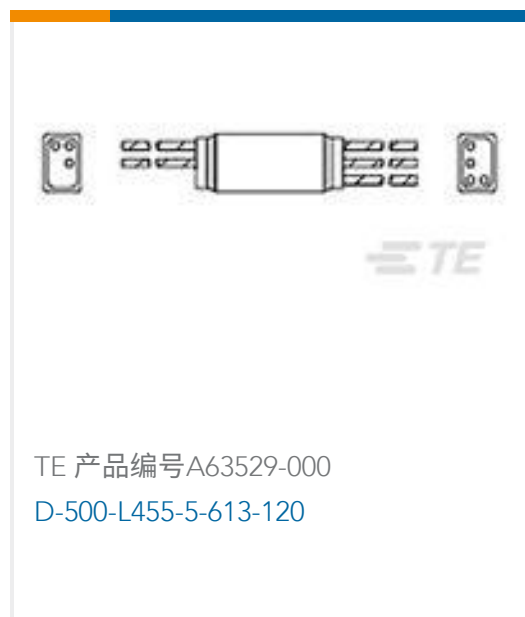
TE 产品编号A63529-000 D-500-L455-5-613-120