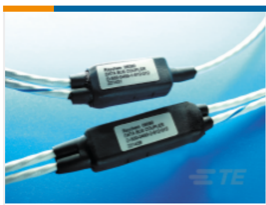
TE 产品编号177301-000 D-500-0255-240-1