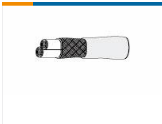
TE 产品编号6050013001 55/9957-24-6/9-9(LAT3)