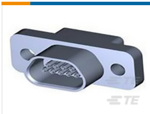
TE 产品编号2-1532185-6 M83513/03-G10C, MCKS-C2-B-51P6Q1-36.0