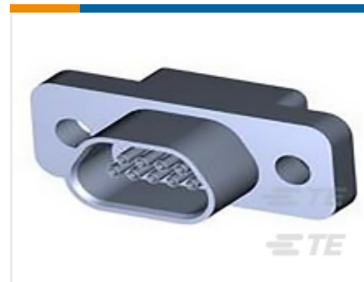
TE 产品编号2-1532182-6 M83513/03-D10C, MCKS-C2-B-25P6Q1-36.0