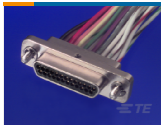
TE 产品编号1532186-7 M83513/03-H11N, MCKS-N1-B-100P6Q9-18.0