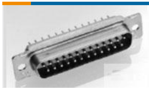
TE 产品编号1218124-5 50 POS,ASSY,PLUG,LOW PROF,109