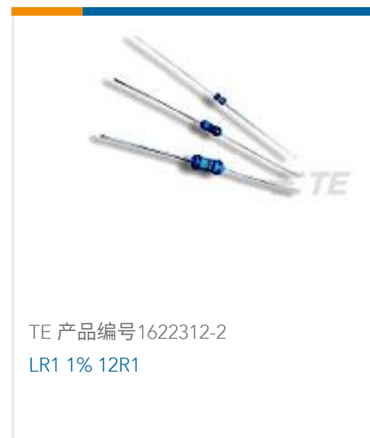
TE 产品编号1622312-2 LR1 1% 12R1