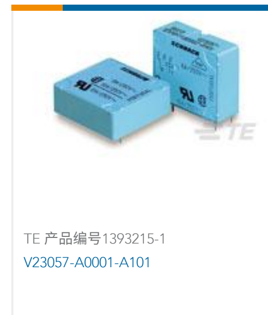
TE 产品编号1393215-1 V23057-A0001-A101