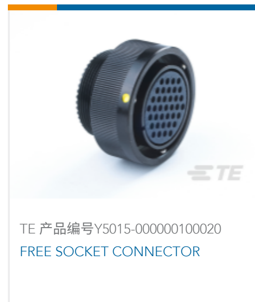
TE 产品编号Y5015-000000100020 FREE SOCKET CONNECTOR