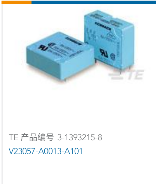
TE 产品编号 3-1393215-8 V23057-A0013-A101