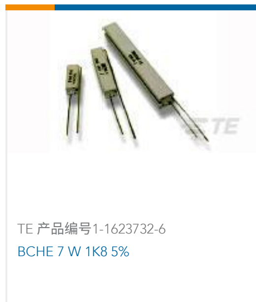
TE 产品编号1-1623732-6 BCHE 7 W 1K8 5%