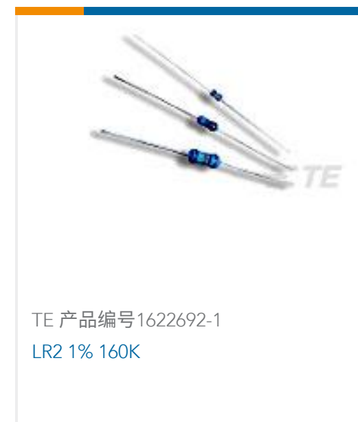
TE 产品编号1622692-1 LR2 1% 160K