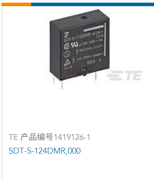
TE 产品编号1419126-1 SDT-S-124DMR,000