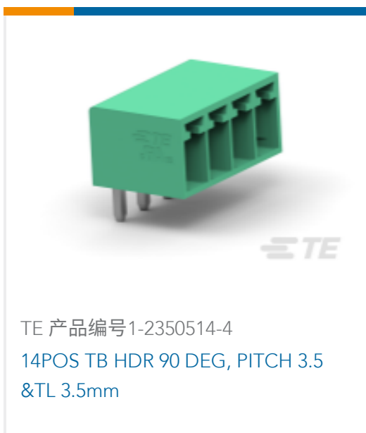
TE 产品编号1-2350514-4 14POS TB HDR 90 DEG, PITCH 3.5 &TL 3.5mm