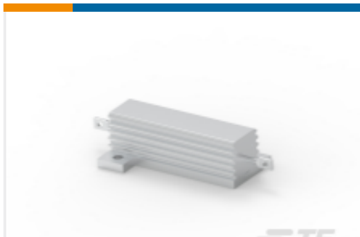
TE 产品编号6-1630186-5 HSA50 2R2 1%