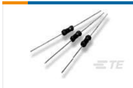
TE 产品编号4-1879353-3 RR02 5% 240K AMMO