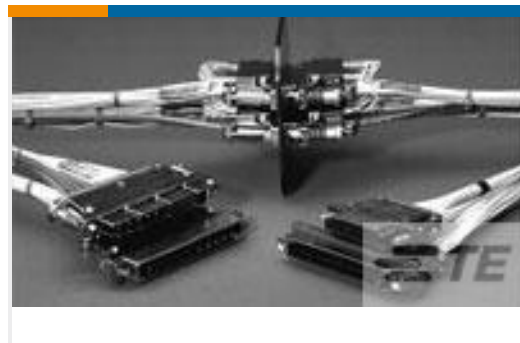
TE 产品编号605415-000 MTC100-BJ2-P23