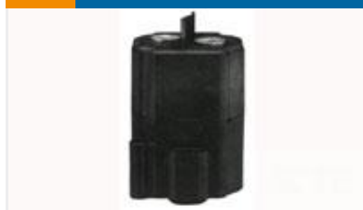
TE 产品编号2-1618002-3 EV250-1B=RELAY, SPST-NO