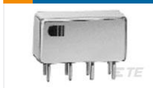
TE 产品编号2-1617039-6 HMS1201S110L = M39016/44-026L