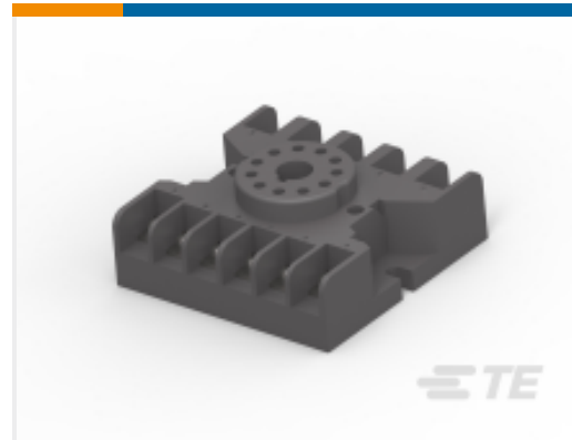
TE 产品编号1393143-7 27E123=SOCKET, KRP, 11, SCW, PLE