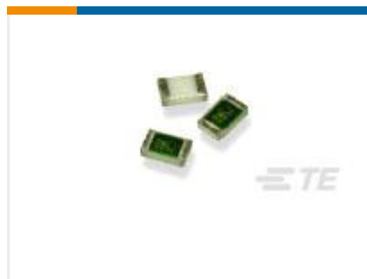
TE 产品编号1879214-4 CPF 0402 348R 0.1% 25PPM 1K RL