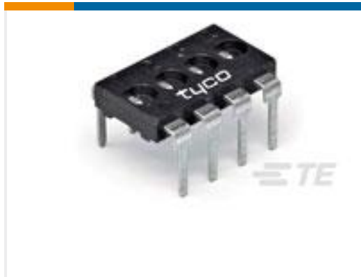
TE 产品编号1825190-7 DIP Shunt,8 pos