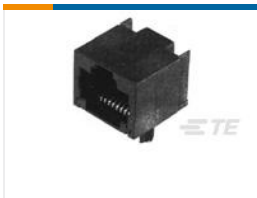
TE 产品编号1-406525-2 IMJ, NO SHLD, 8P, PCK&PLC TRAY, SN