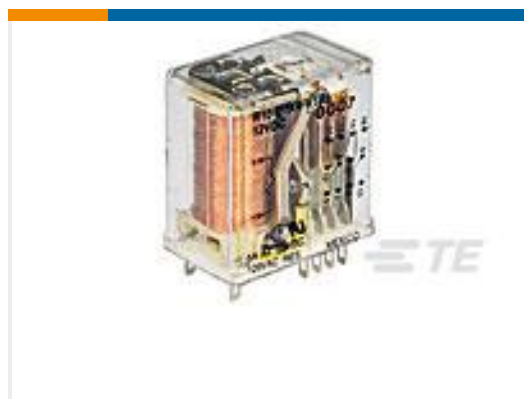
TE 产品编号1-1393766-4 R10-E1X4-V185=R10