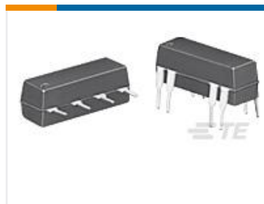
TE 产品编号1393771-3 JWD-107-1=REED RELAYS