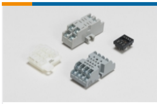
继电器附件、插座和卡箍(34)