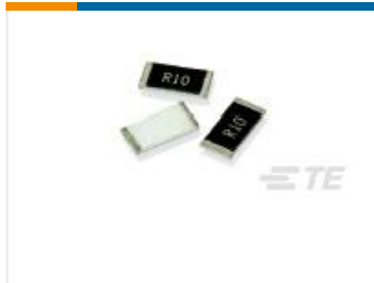
TE 产品编号1-2176051-9 RLP73N 1J R30 1% 1K RL