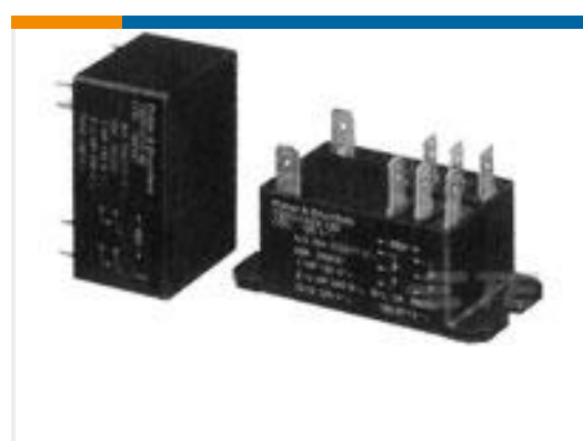
TE 产品编号1423008-9 T92P7D24-24