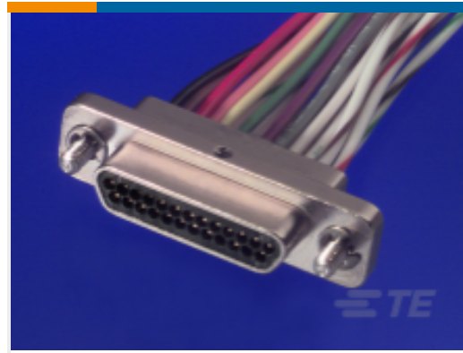
TE 产品编号2-1532179-3 M83513/03-A07C, MCKS-C2-B-9P5L5-0.5