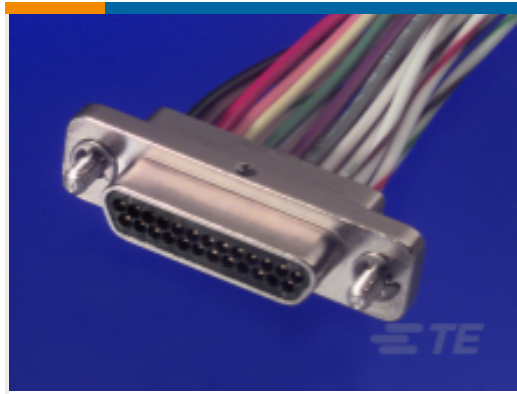
TE 产品编号2-1532172-3 M83513/04-B07C, MCKS-C2-B-15S5L5-0.5