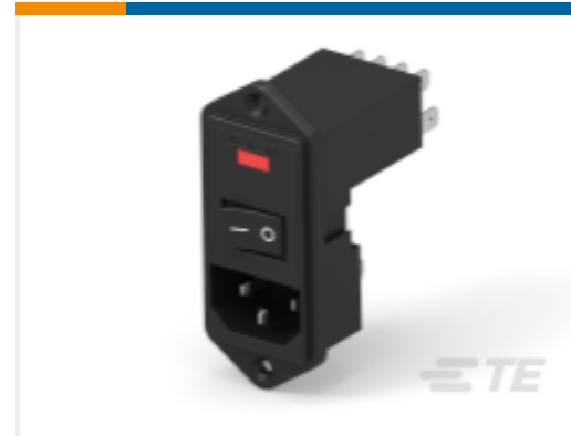
TE 产品编号3-6609959-9 PM0SSD000=C5253