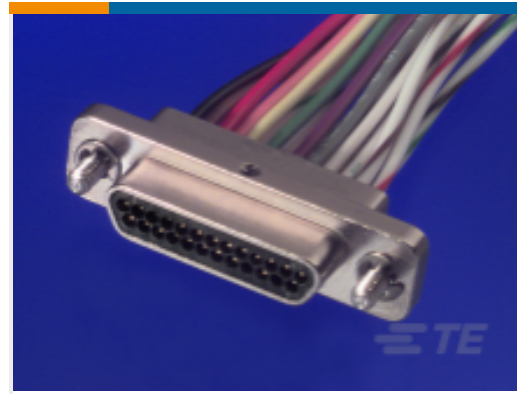
TE 产品编号2-1532180-3 M83513/03-B07C, MCKS-C2-B-15P5L5-0.5