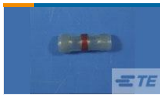
TE 产品编号359539-000 D-108-10CS948