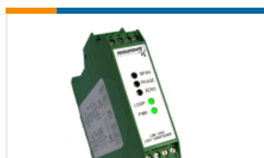
TE 产品编号02291333-000 LDM-1000 LVDT CONDITIONER DIN