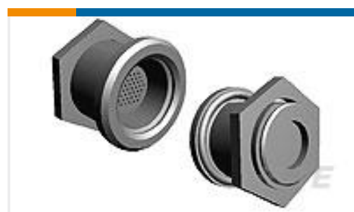
TE 产品编号1589690-5 QCM044SC2DC018F = CIRCULAR