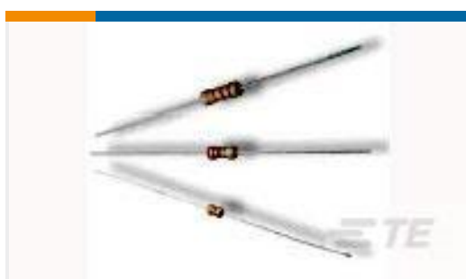
TE 产品编号1623927-1 CFR16 5% 100K