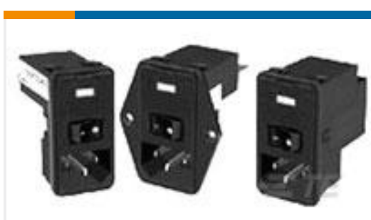
TE 产品编号1-6609101-1 PSOSXS000=C1011