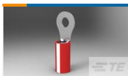
TE 产品编号1-320551-4 TERMINAL,PIDG R IR 18 8