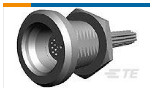
TE 产品编号1589058-4 QCM019SC2DC018F = CIRCULAR