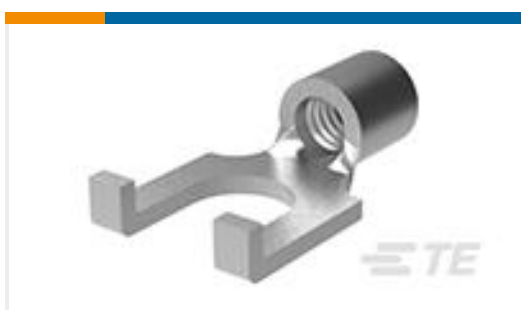
TE 产品编号324605 SOLIS SPFLG 22-16COM22-18MIL 2