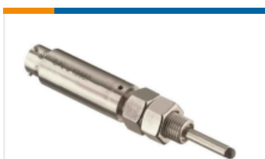
TE 产品编号02350499-000 GA-HD GCA-121-050 ASSY