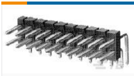
TE 产品编号 1-146309-3 26 MODII HDR DRRA B/A .100CL