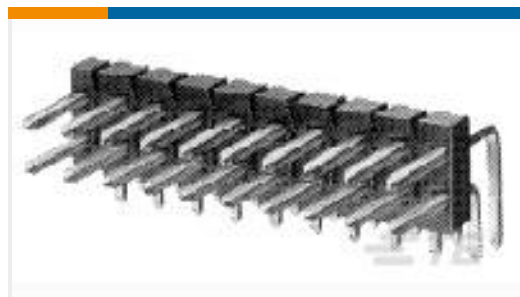
TE 产品编号 5-146309-2 04 MODII HDR DRRA B/A .100CL