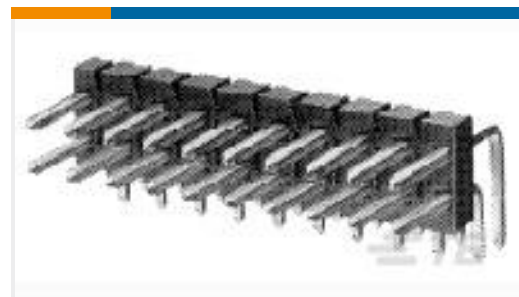
TE 产品编号 9-146309-0 80 MODII HDR DRRA B/A .100CL