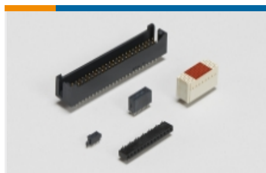
板对板接头和插座(1243)