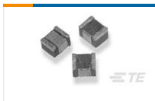
TE 产品编号4-1624112-0 3650 0402 9.0nH 5% 2K RL