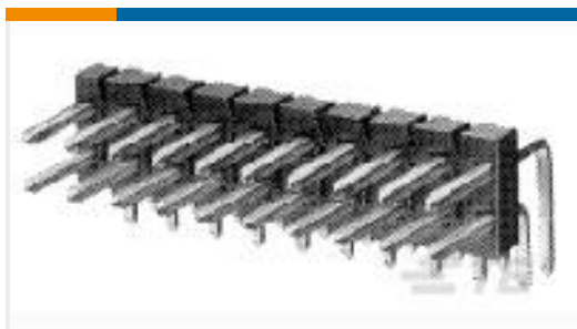
TE 产品编号 5-146309-6 12 MODII HDR DRRA B/A .100CL