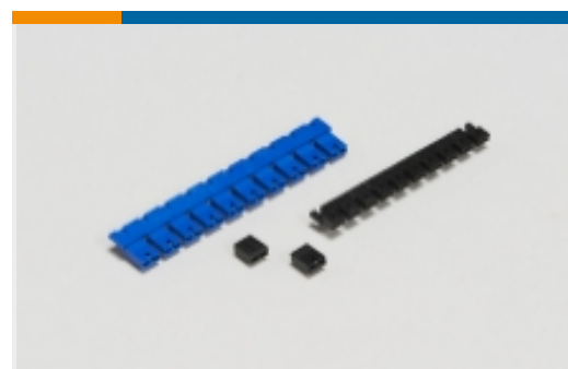
板对板跳线和分路(5)