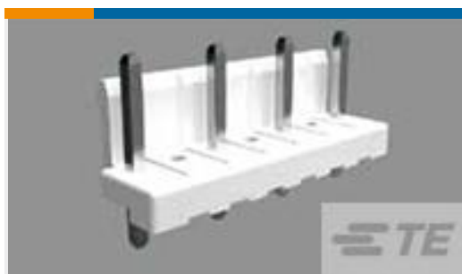
TE 产品编号7-1123724-4 EP CONN.HDR ASSY 4/7P GRAY (NO. 2,4,6 POS)