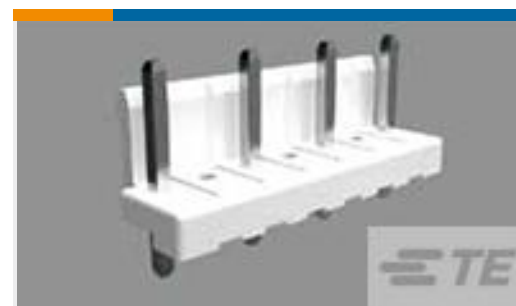
TE 产品编号9-1123724-4 EP CONN.HDR ASSY 4/7P ORANGE (NO.2,4,6 P)