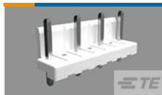
TE 产品编号8-1123724-4 EP CONN.HDR ASSY 4/7P PINK (NO. 2,4,6 POS)