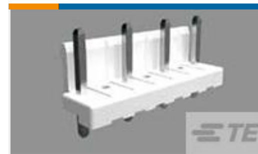
TE 产品编号6-1123724-4 3.96EP HDR ASSY 4(7)P GREEN