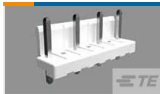
TE 产品编号2-1123724-4 3.96EP HDR ASSY 4(7)P YELLOW