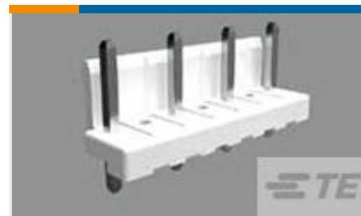
TE 产品编号4-1123724-5 3.96EP HDR ASSY 5(9)P RED