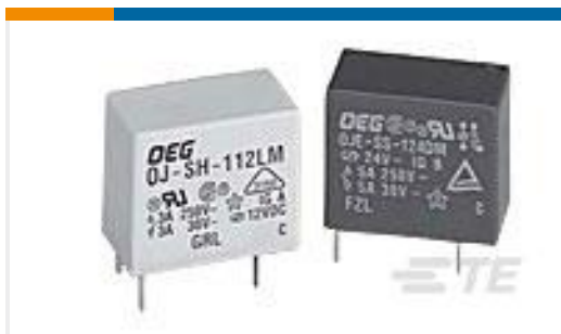
TE 产品编号8-1419128-1 OJ-SH-105LMH,000