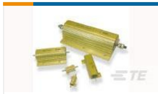
TE 产品编号3-1625966-5 HSA10 3R9 5%