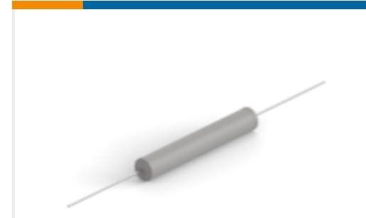
TE 产品编号5-2176416-9 9W STD M/OX 5% 13K