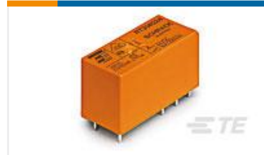
TE 产品编号3-1419136-9 RT31LA06