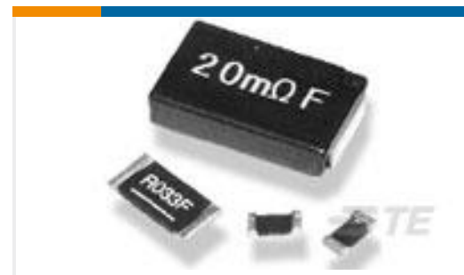
TE 产品编号2176155-2 TLM 0805 0.25W R012 5% 100PPM 5K RL