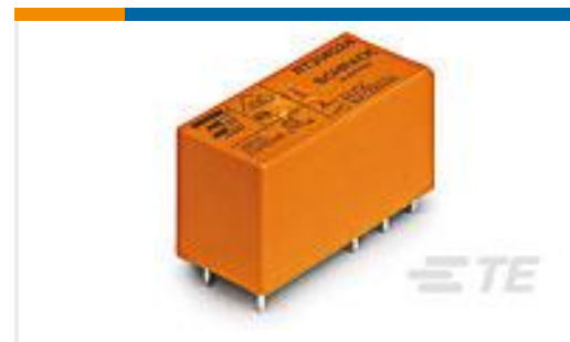
TE 产品编号3-1415402-1 RT31LF12