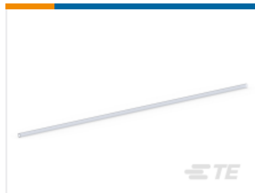
TE 产品编号 5069806043 RNF-100 单壁件 HS 热缩管