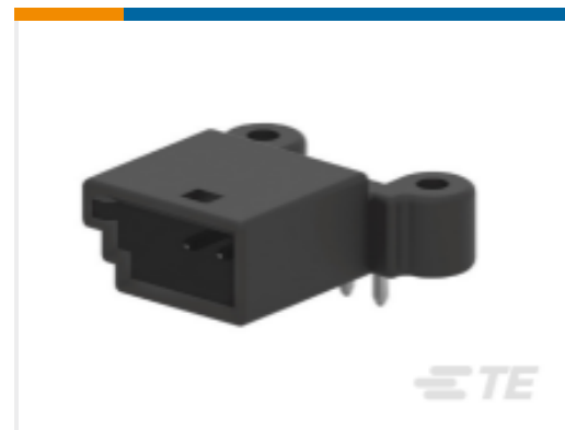
TE 产品编号 1-1565749-1 信号接头