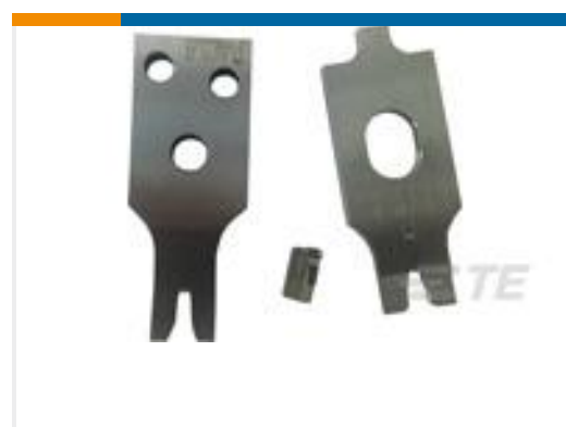
TE 产品编号 7-2151602-7 OCEAN_2.0_SPARE_PART_KIT-055F0720