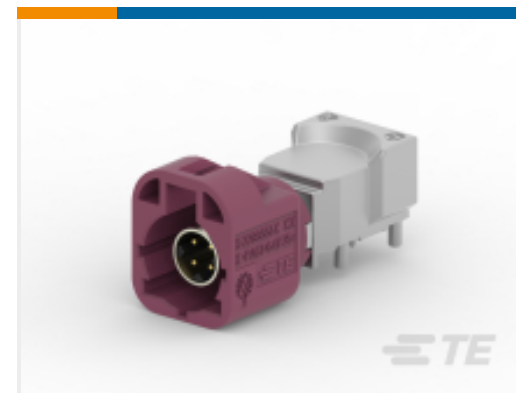
TE 产品编号 2286546-4 HSD,HDR ASSY,90DEG,COD D