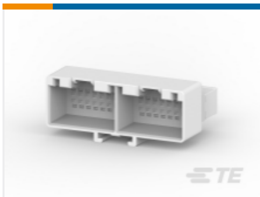
TE 产品编号 1-2298645-2 MQS TAB HOUSING, 32POS