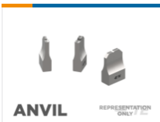
TE 产品编号 5-1803054-9 ANVIL, COMBINATION