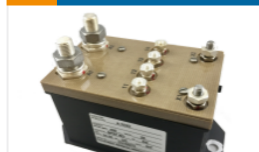
TE 产品编号4-1616058-2 A770WA2 (FAA/PMA)=RELAY