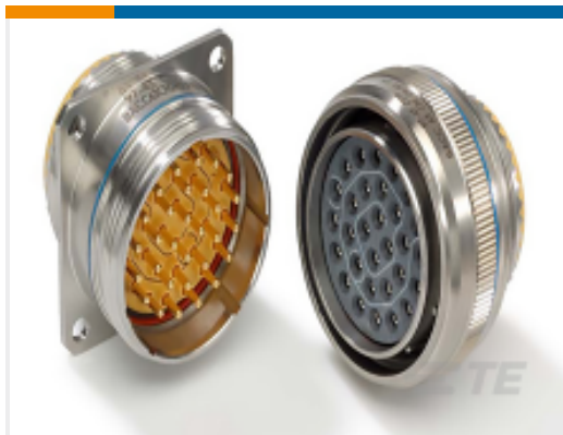
TE 产品编号ZPF000000000034795 983-6K 16-10 SN-L