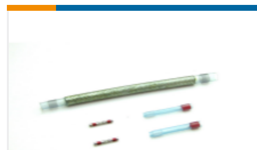
TE 产品编号242573-000 D-150-0232CS2075