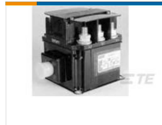
TE 产品编号1616045-5 B461D1 (FAA/PMA)=CONTACTOR- TPDT CENTER O