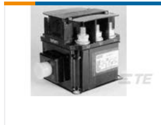
TE 产品编号1616023-2 B430Z (FAA/PMA)=RELAY