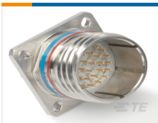
TE 产品编号 YDTS20T21-41PAV001 RECP ASSY