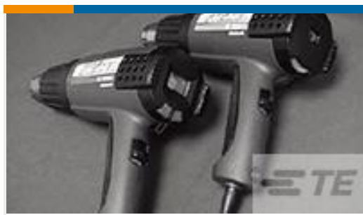
TE 产品编号 CJ2087-000 HL2010E-KIT-120V