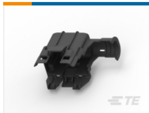
TE 产品编号1924002-1 Wire Guide, 34 Way, Left Out