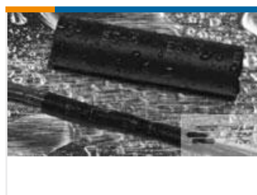
TE 产品编号636901P034 QS1500-NO.3-F7-0-40MM