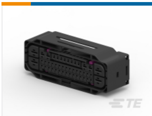
TE 产品编号1-2209520-1 46POS. REC. HSG ASSY