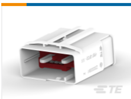
TE 产品编号2300007-2 24POS,0.64X0.64,TAB HSG ASSY