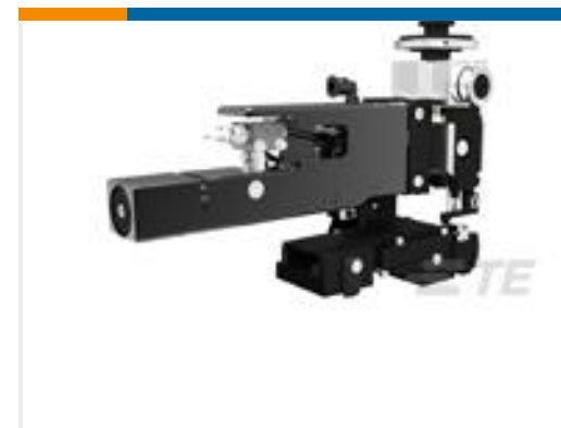
TE 产品编号2151781-2 OC-AT-S-FA-156F431O-001-0211