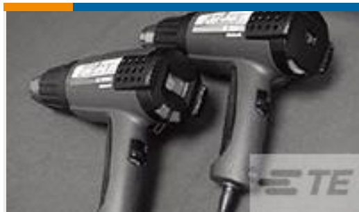
TE 产品编号 CJ2087-000 HL2010E-KIT-120V