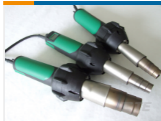
TE 产品编号 EG1114-000 CV1981-ST-230V1600W-EU