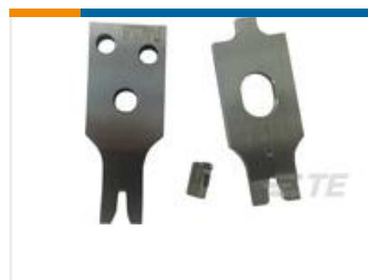
TE 产品编号7-2151781-7 OC-156F431O-CRIMPTOOLINGKIT