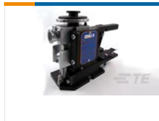
TE 产品编号2150363-1 OCEAN_2.0_Applicator-E-100F180F