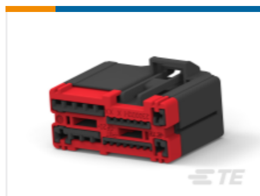
TE 产品编号2300010-2 24POS,0.64 GENER. Y,REC HSG ASSY