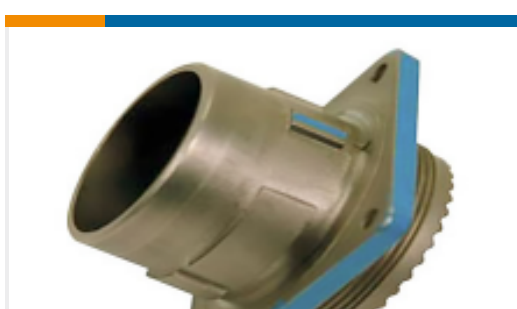
TE 产品编号 YDIV46E11-99SNC009 PLUG ASSY