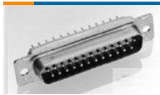
TE 产品编号 1757823-3 AMPLIMITE,ASY,PLUG,STD,90,ZN,3