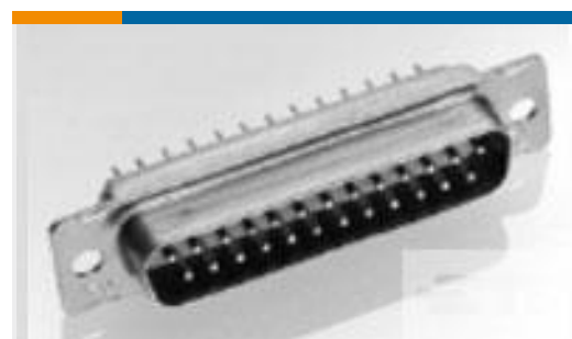
TE 产品编号 205166-1 AMPLIMITE,ASY,PLUG,STD,109,3