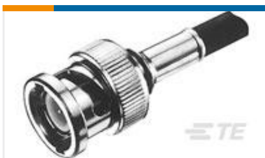
TE 产品编号 2-331350-9 BNC PLUG