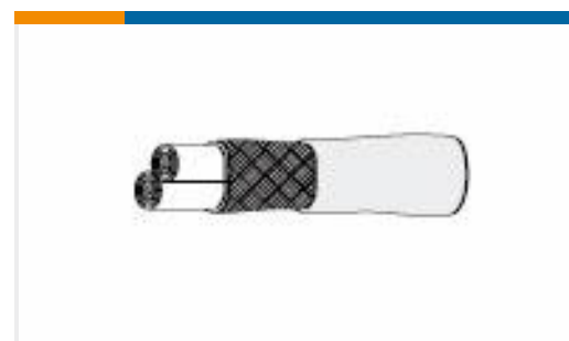
TE 产品编号 575673-000 55A1813-20-9-9CS2275