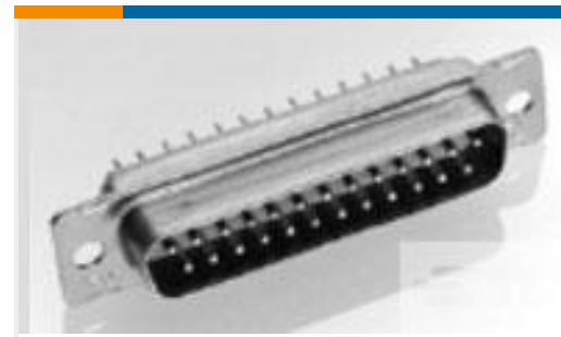
TE 产品编号 205161-1 AMPLIMITE,ASY,RCPT,STD,109,1