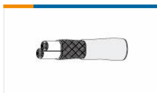
TE 产品编号 648101-000 55A1823-22-9/96-9CS2275