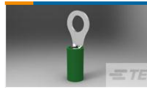
TE 产品编号 50832-1 TERMINAL,PIDG PTFE R 22-20 10