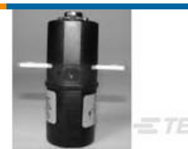
TE 产品编号 7-1616941-3 K400B3C05=CONTACTOR SPST DB 400 AMP 28 V