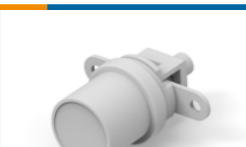
TE 产品编号 K1022867 Relay 26-73-03-901