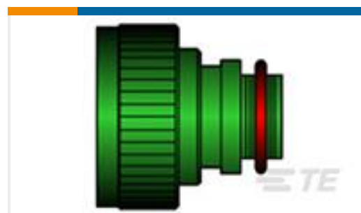
TE 产品编号768849-000 TXR54AC00-2014BI