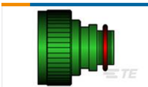
TE 产品编号614763-000 TXR54AC00-1608BI