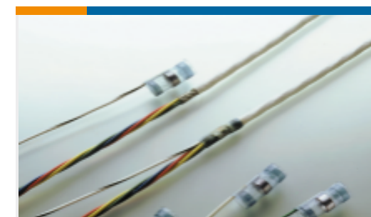
TE 产品编号460870N003 S02-07-R-9CS925