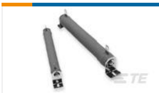
TE 产品编号3-1879448-6 TE 300W 820R 5% Bracket