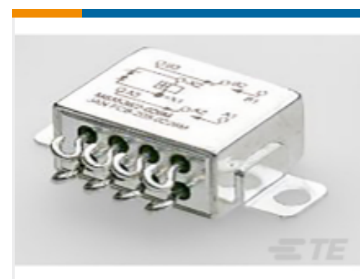
TE 产品编号6-1617780-1 FCB-205-0217M=M83536/2-017M