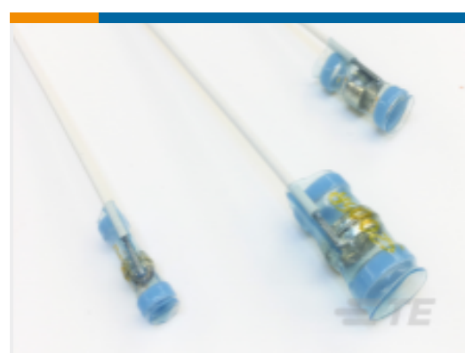
TE 产品编号EH1934-000 S200-1-55-22-9