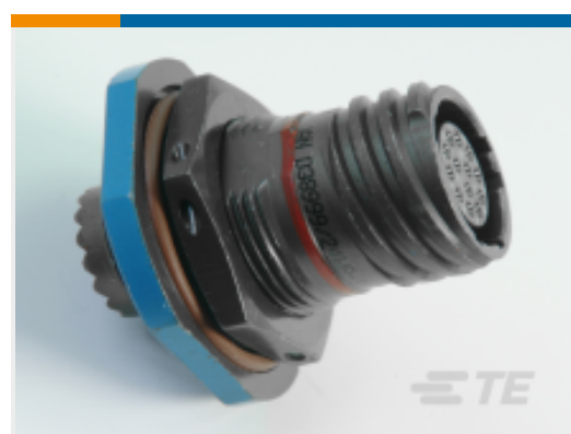
TE 产品编号YDTS24F25-35PEC001 RECP ASSY