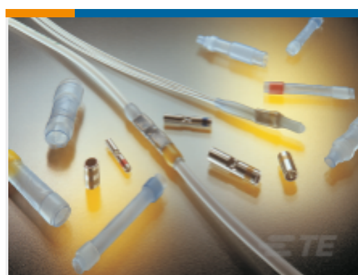
TE 产品编号703835-000 D-106-6015