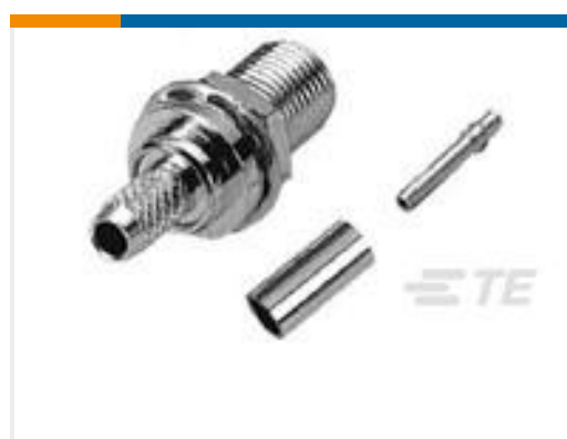
TE 产品编号1060883-1 5834 7388 10,OSX CABLE JACK