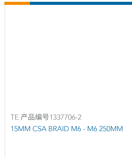
TE 产品编号1337706-2 15MM CSA BRAID M6 - M6 250MM