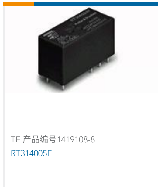
TE 产品编号1419108-8 RT314005F