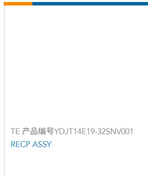
TE 产品编号YDJT14E19-32SNV001 RECP ASSY