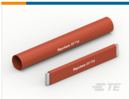
TE 产品编号478203-000 BPTM-30/12-A/U(B50)