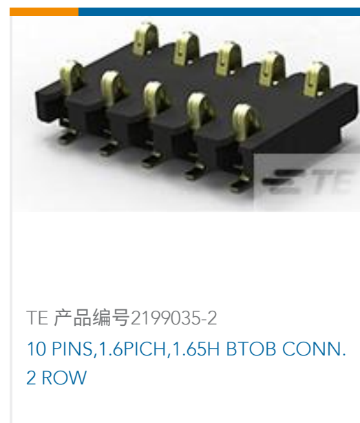
TE 产品编号2199035-2 10 PINS, 1.6 PITCH, 1.65 H BTOB CONN. 2 ROW