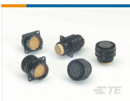
TE 产品编号 ZPF000000000145670 FDBA 54-14-4 SN-K 090