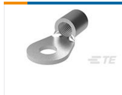
TE 产品编号 2-33466-1 SOLISTRAND RING 6 5/16