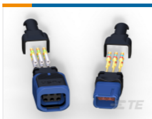
TE 产品编号 D369-P99-DS1 369 9 WAY PLUG, CRIMP, SKT