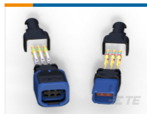
TE 产品编号 D369-R33-AP1 369 3 WAY REC, CRIMP, PIN