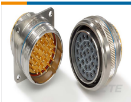
TE 产品编号 ZPF000000000105667 983-6A 12-03 SN-A246