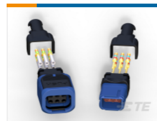
TE 产品编号 D369-R33-CP1 369 3 WAY REC, CRIMP, PIN