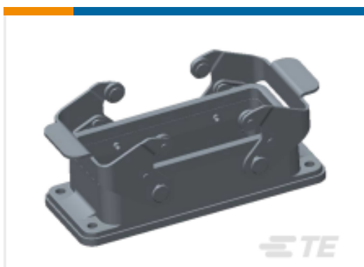
TE 产品编号T1410161000-000 H16B-AGS