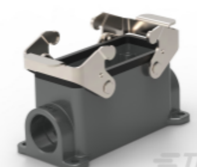
TE 产品编号 T1440162221-000 H16B-SGR-2PG21