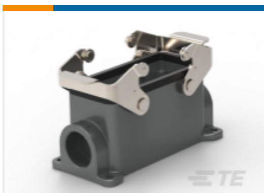
TE 产品编号T1440161121-000 H16B-SGRS-PG21