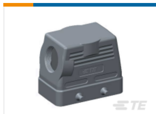
TE 产品编号T1210100116-000 H10B-TS-PG16