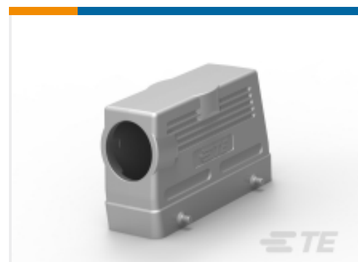
TE 产品编号T1230240129-000 H24B-TSH-PG29