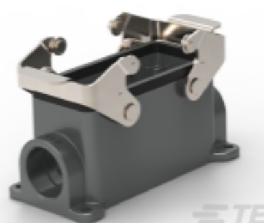
TE 产品编号 T1440161221-000 H16B-SGRS-2PG21