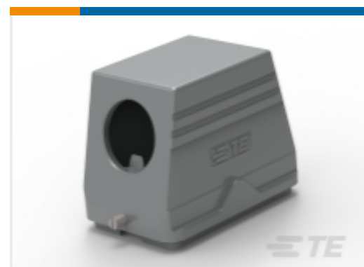
TE 产品编号T1310480136-000 H48B-TS-RO-PG36