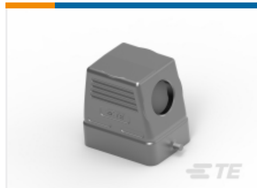
TE 产品编号T1310060116-000 H6B-TS-PG16