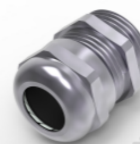
TE 产品编号 T3609210101-000 DLX-21-MS