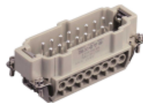
TE 产品编号 T2040162101-000 HE-016-M