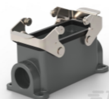
TE 产品编号 T1440161121-000 H16B-SGRS-PG21