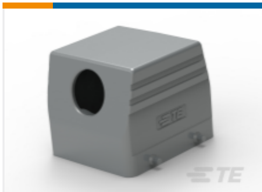
TE 产品编号T1210320129-000 H32B-TS-PG29