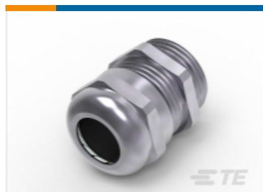
TE 产品编号T3609210101-000 DLX-21-MS