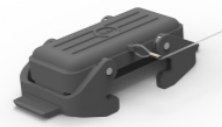
TE 产品编号 T1010161200-000 H16B-KDTP