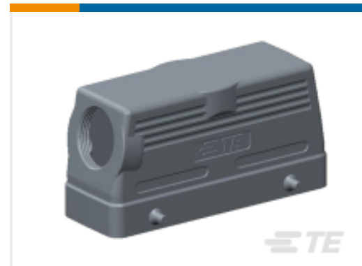
TE 产品编号T1210240121-000 H24B-TS-PG21