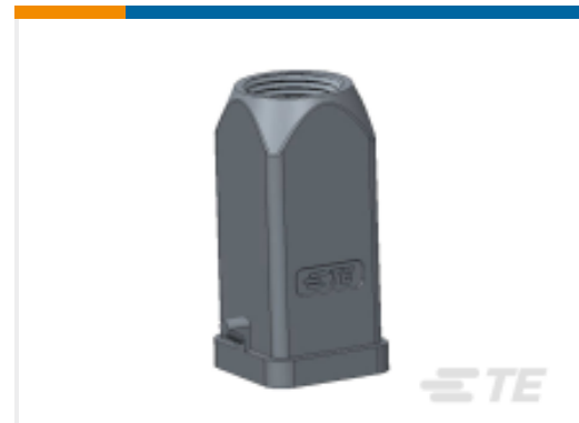
TE 产品编号T1329030120-000 H3A-MTG-M20