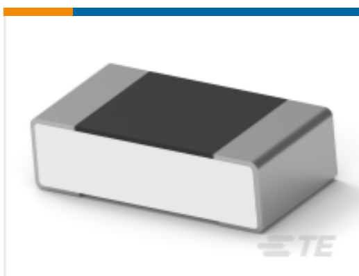
TE 产品编号 5-2176366-1 RQ 0603 1K43 0.1% 10PPM 1K RL