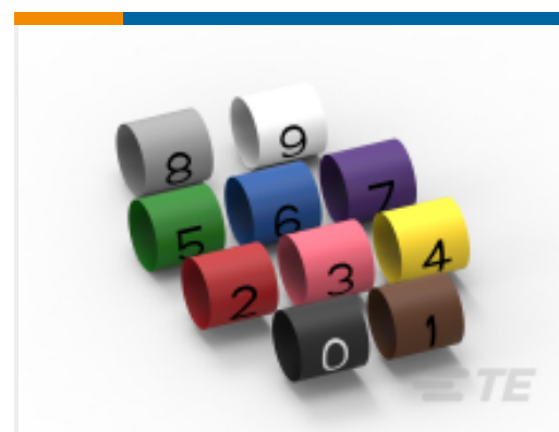
TE 产品编号 5059070049 TRSA-1014/C/1/A