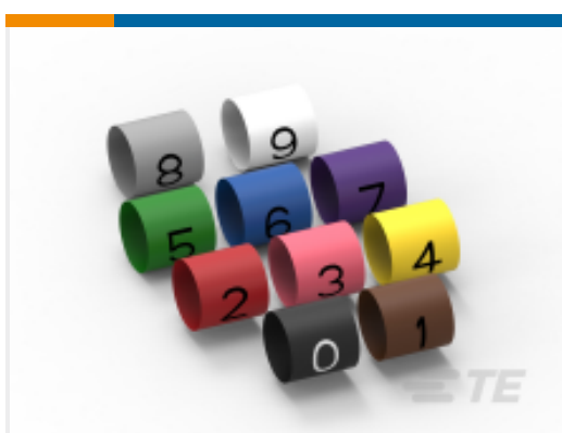
TE 产品编号 5059080050 TRSA-1014/C/2/20