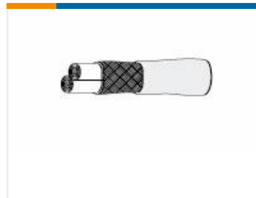
TE 产品编号 917341-000 55A1122-22-9/96-9