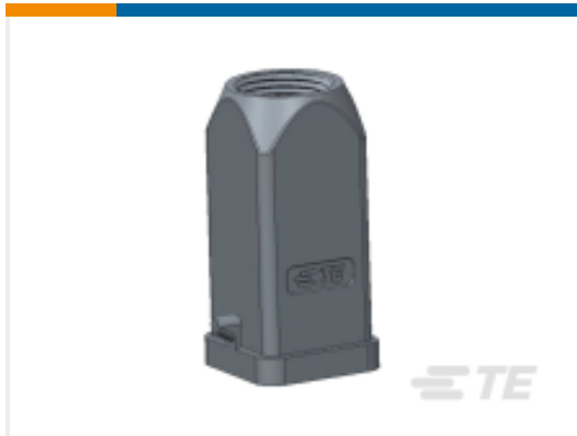
TE 产品编号T1329030120-000 H3A-MTG-M20