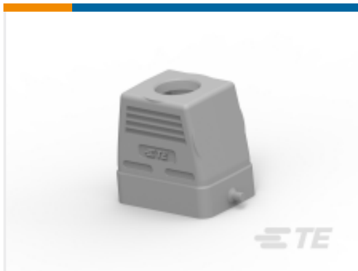
TE 产品编号T1320060121-000 H6B-TG-PG21