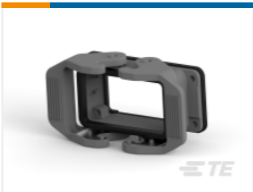
TE 产品编号T1410100000-000 H10B-AG-SL