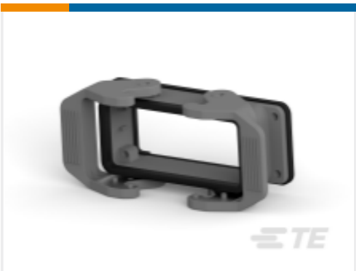
TE 产品编号T1410160000-000 H16B-AG-SL