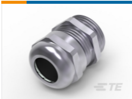
TE 产品编号T3609250102-000 DLX-25-M