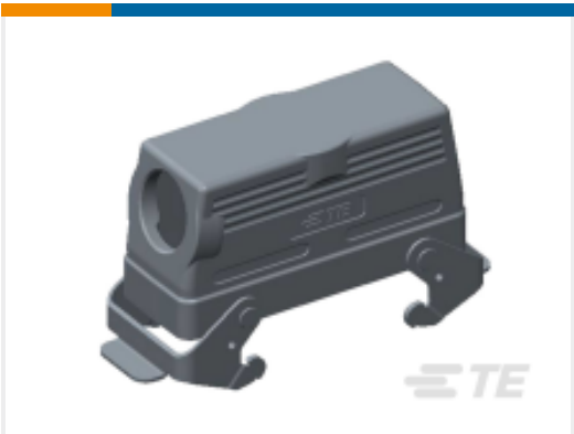
TE 产品编号T1250242121-000 H24B-TSB-PG21