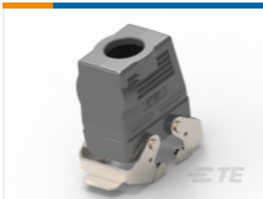
TE 产品编号T1280102132-000 H10B-TGBH-M32