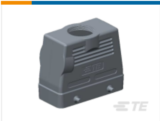
TE 产品编号T1240160132-000 H16B-TGH-M32