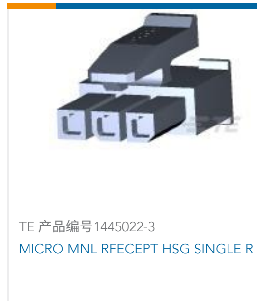
TE 产品编号1445022-3 MICRO MNL RFCEPST HSG SINGLE R