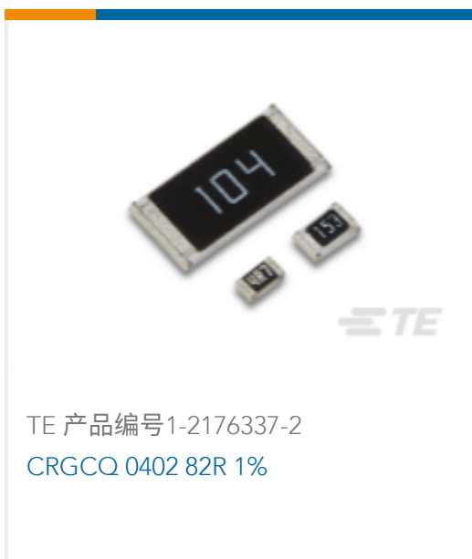
TE 产品编号1-2176337-2 CRGCO 0402 82R 1%