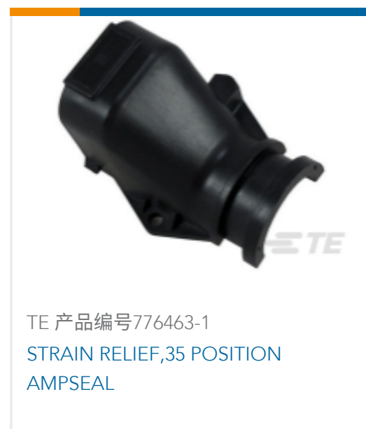
TE 产品编号776463-1 STRAIN RELIEF, 35 POSITION AMPSEAL