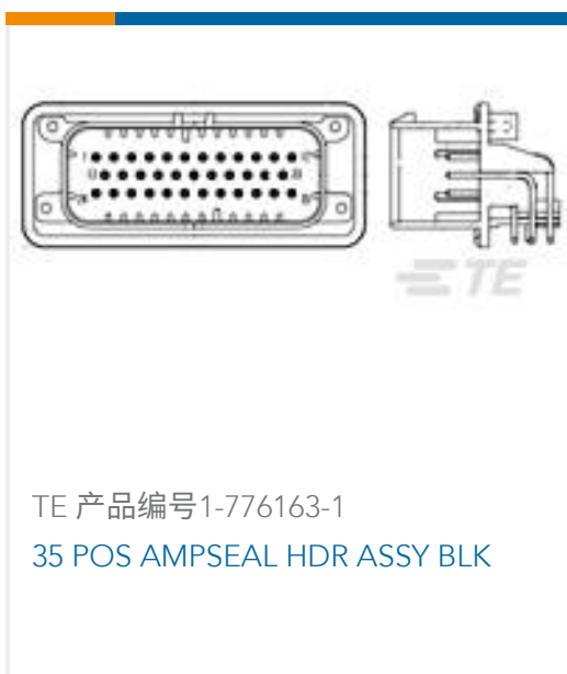
TE 产品编号1-776163-1 35 POS AMPSEAL HDR ASSY BLK