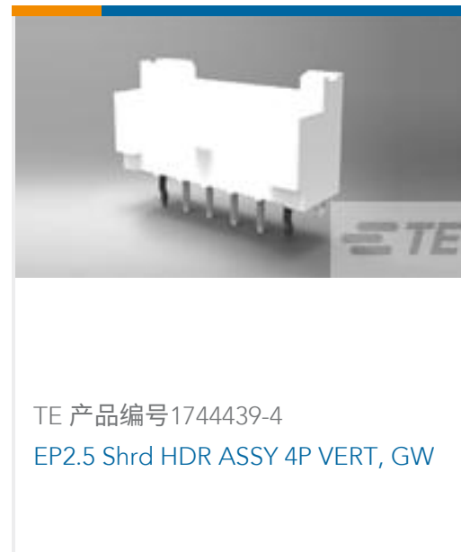
TE 产品编号1744439-4 EP2.5 Shrd HDR ASSY 4P VERT, GW