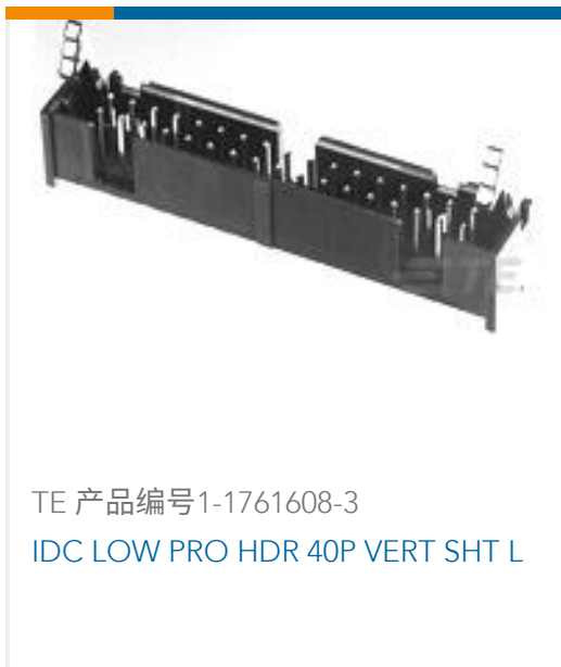
TE 产品编号1-1761608-3 IDC LOW PRO HDR 40P VERT SHT L