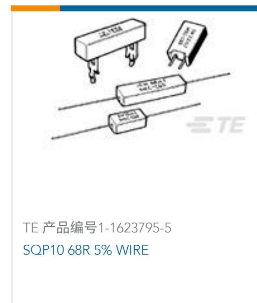
TE 产品编号1-1623795-5 SOP10 68R 5% WIRE