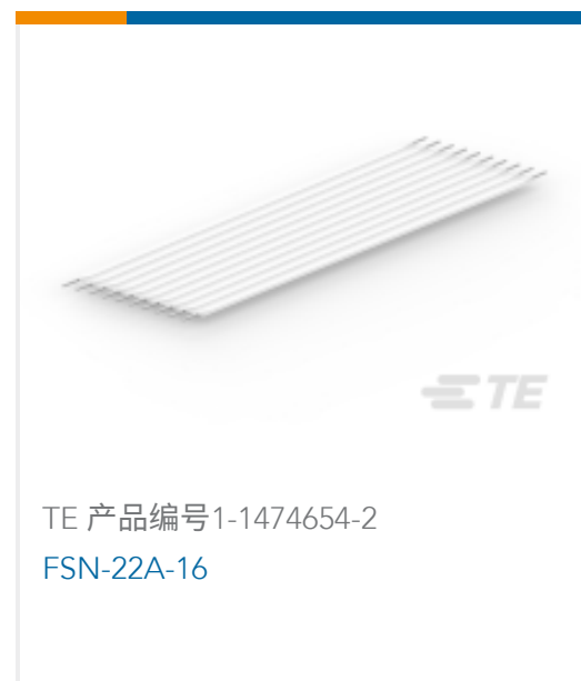
TE 产品编号1-1474654-2 FSN-22A-16