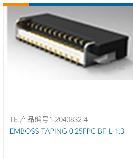
TE 产品编号1-2040832-4 EMBOSS TAPING 0.25FPC BF-L-1.3