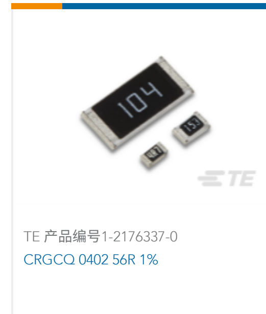
TE 产品编号1-2176337-0 CRGCO 0402 56R 1%