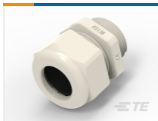
TE 产品编号T3209211201-000 HSK-P21G