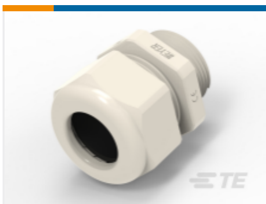
TE 产品编号T3209291201-000 HSK-P29G