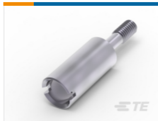
TE 产品编号T0931006524-000 CODING-PIN-M3-TF