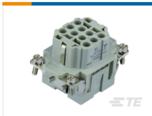
TE 产品编号T2050102201-000 HEE-010-F