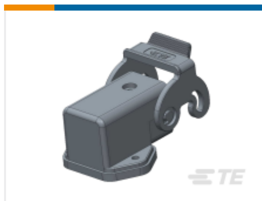
TE 产品编号T1509031111-000 H3A-AGS