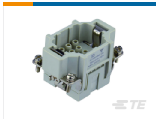
TE 产品编号T2050102101-000 HEE-010-M