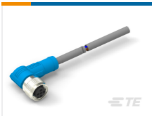
TE 产品编号T4151420004-007 RPC-M12-FR-4CON-PUR-10.0