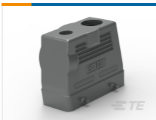
TE 产品编号T1240163225-000 H16B-TGH-M32/M25