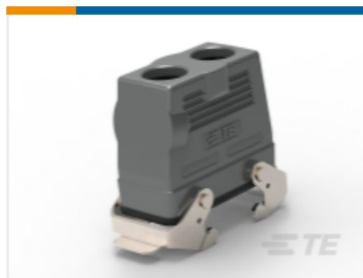
TE 产品编号T1750162225-000 H16B-TBFH-2M25