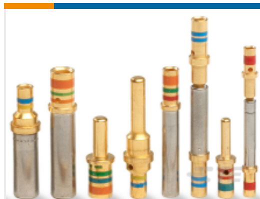
TE 产品编号106044-31 CONT SOC ASSY