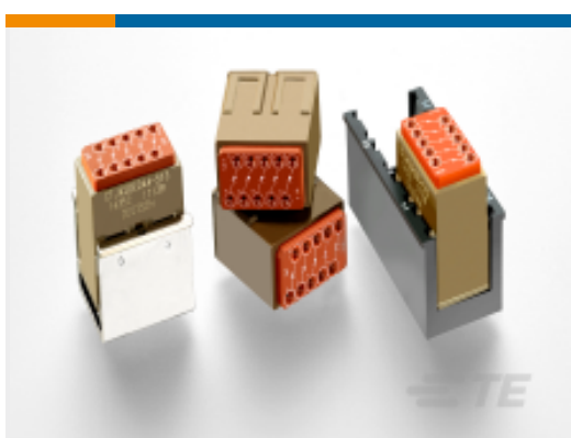
TE 产品编号CTJ420E320-513 ELEC MODULE