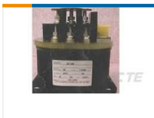
TE 产品编号1616042-3 SA120B=CONTACTOR, 3PDT-SS, 60A