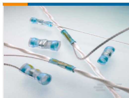
TE 产品编号CB0217-000 S200-5-W2-20-9