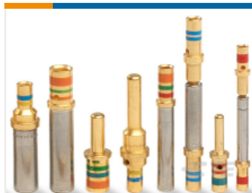
TE 产品编号12343-16-20 CONT SOC ASSY