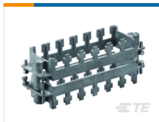
TE 产品编号T2070244001-000 H24BN-T6