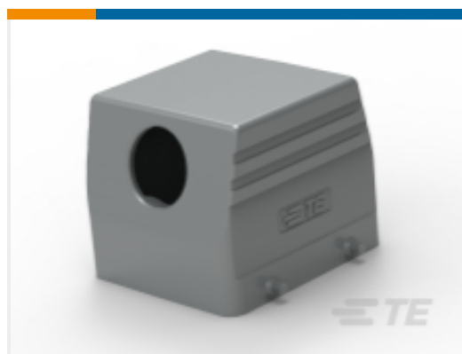
TE 产品编号T1210320136-000 H32B-TS-PG36