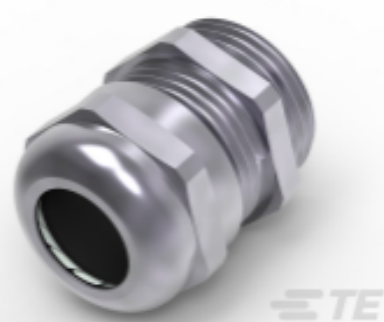
TE 产品编号 T3609160101-000 DLX-16-MS