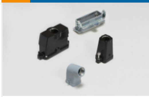
矩形连接器护罩和底座(1258)