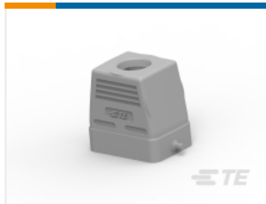
TE 产品编号T1320060116-000 H6B-TG-PG16