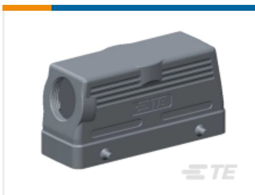
TE 产品编号T1210240121-000 H24B-TS-PG21