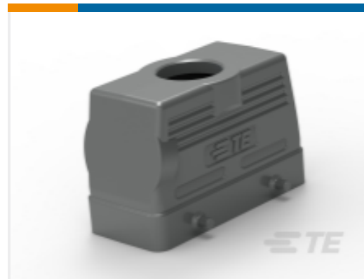
TE 产品编号T1220160121-000 H16B-TG-PG21