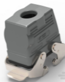
TE 产品编号 T1710101116-000 H10B-TBFS-PG16