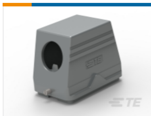
TE 产品编号T1310480136-000 H48B-TS-RO-PG36