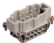
TE 产品编号 T2040102101-000 HE-010-M