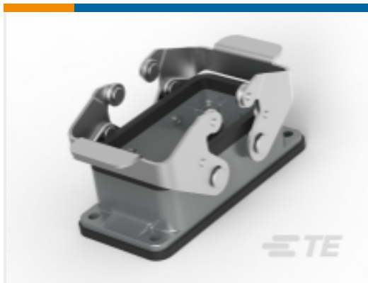
TE 产品编号T1410101000-000 H10B-AGS