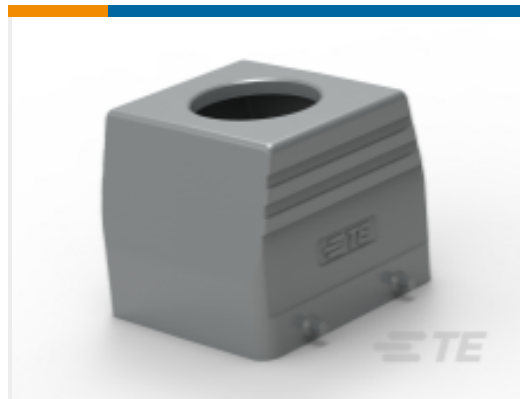
TE 产品编号T1220320136-000 H32B-TG-PG36