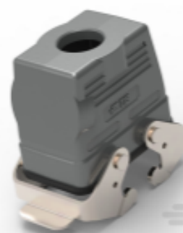
TE 产品编号 T1710102116-000 H10B-TBF-PG16