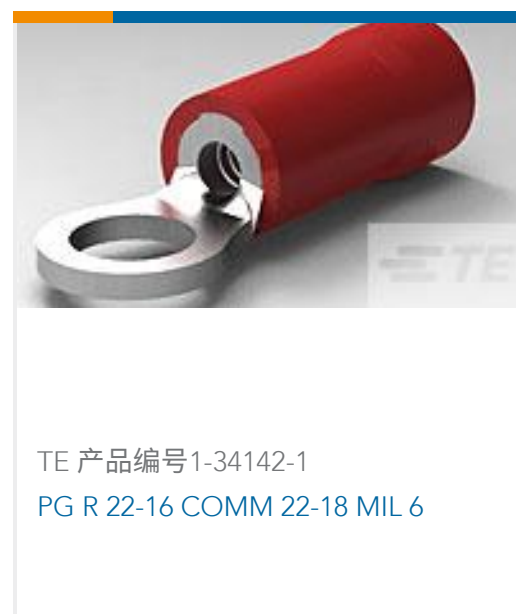
TE 产品编号1-34142-1 PG R 22-16 COMM 22-18 MIL 6