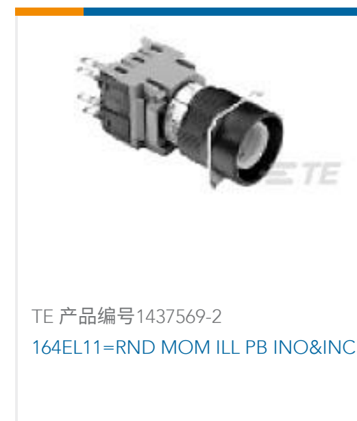
TE 产品编号1437569-2 164EL11=RND MOM ILL PB INO&INC