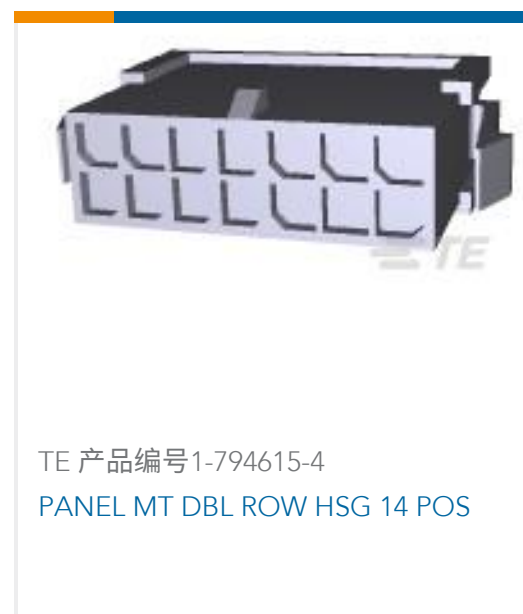
TE 产品编号1-794615-4 PANEL MT DBL ROW HSG 14 POS