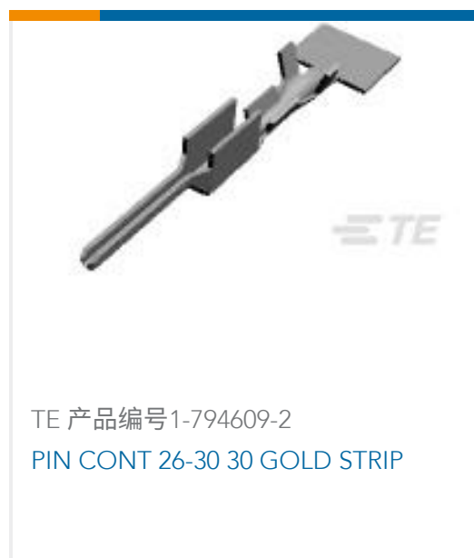
TE 产品编号1-794609-2 PIN CONT 26-30 30 GOLD STRIP